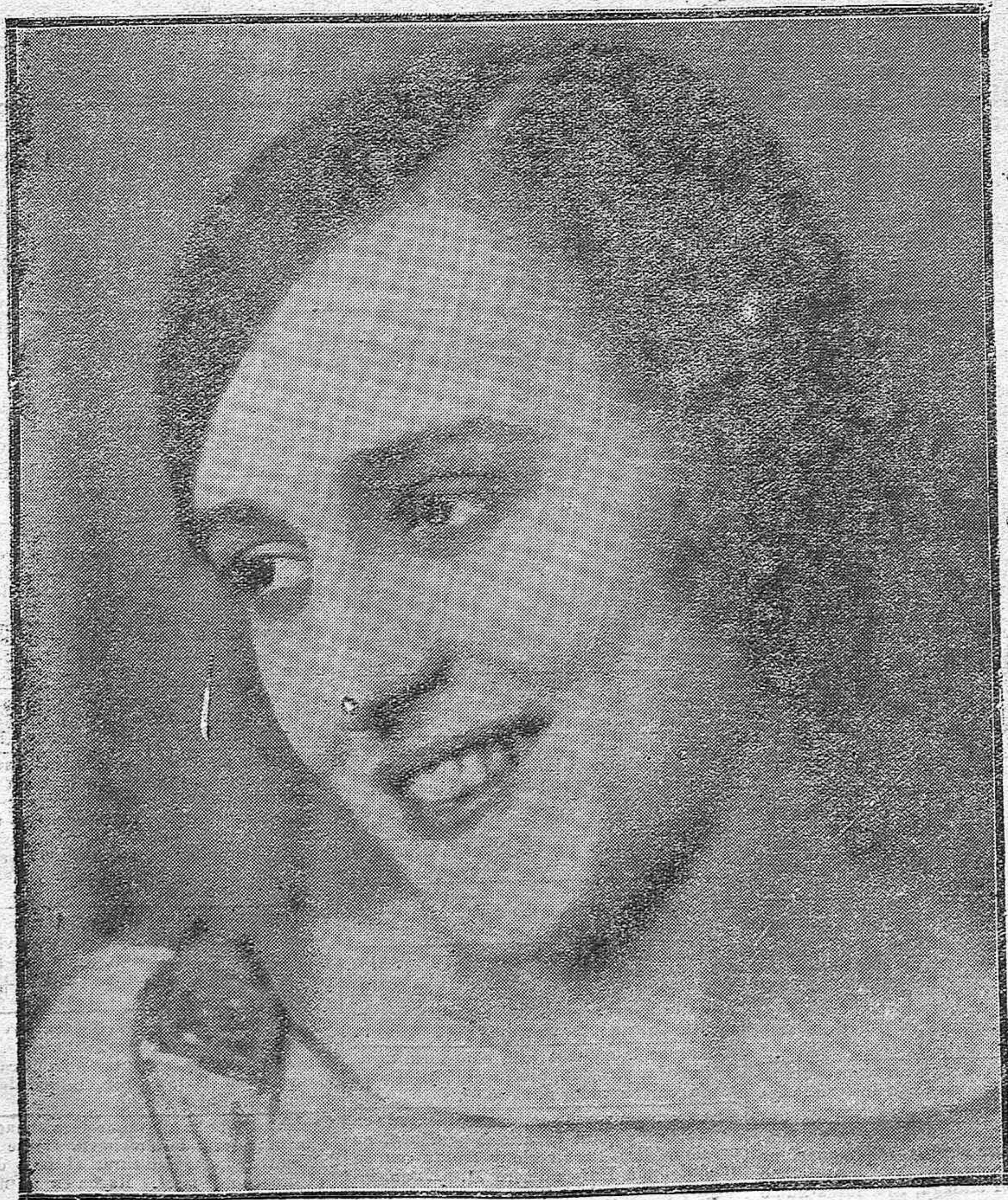
La notable actriz argentina Berta Singerman, que en su actuación del jueves en el Gran Teatro obtuvo un resonante éxito.