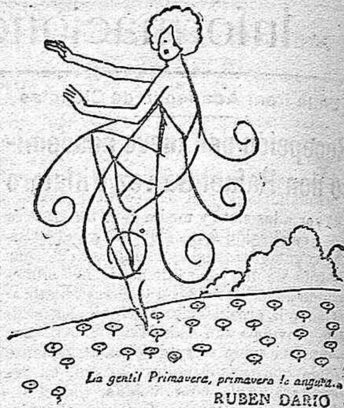
La gentil Primavera, primavera la angustia. RUBEN DARIO

Rectese todo frasco que no lleve en la etiqueta exterior HIPOFOSFITOS SALUD en rojo.