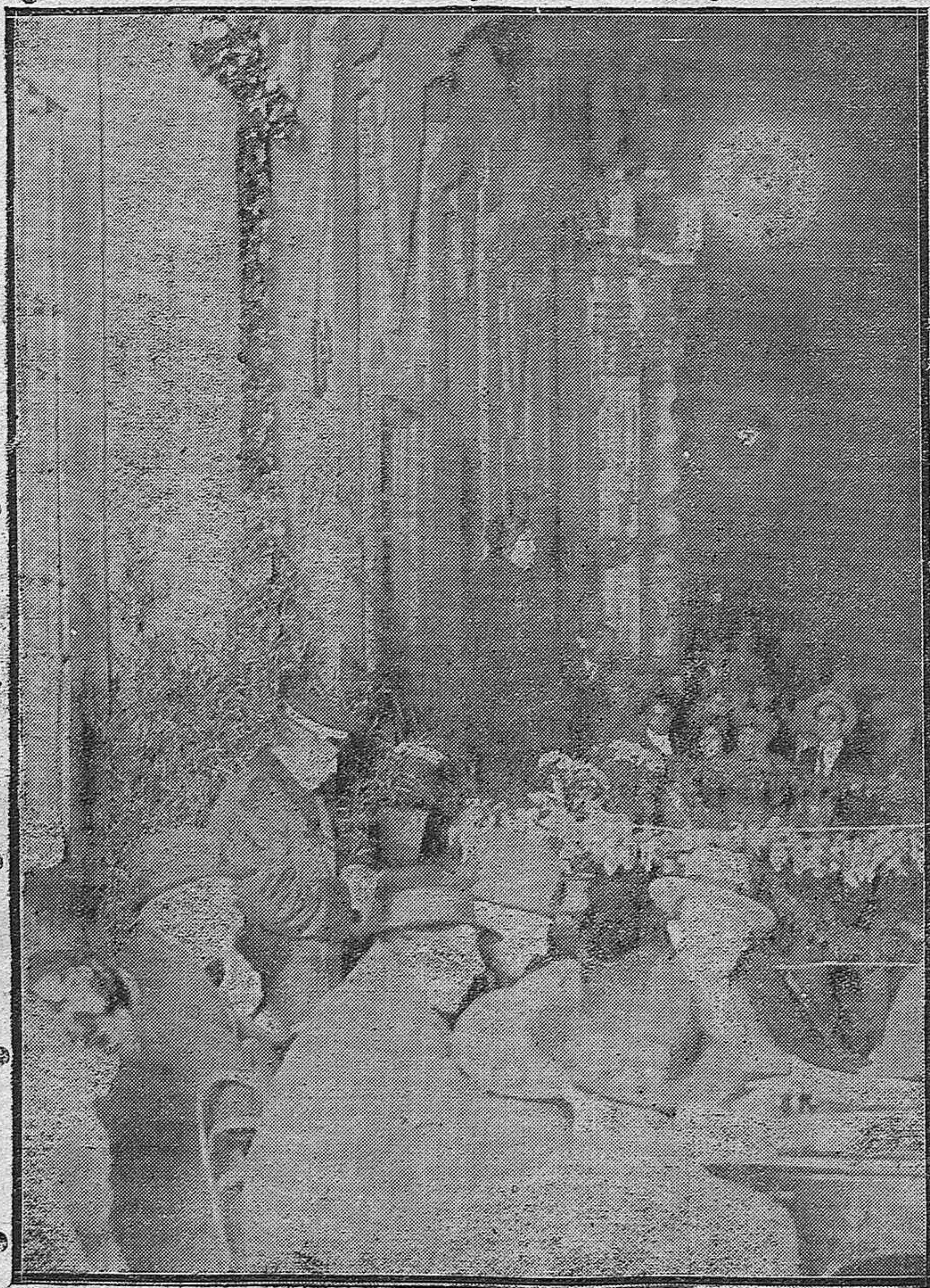
LA SEMANA SANTA EN CORDOBA.--Interesante fotografía obtenida anoche durante el concurso de saetas celebrado ante el convento de la Merced.