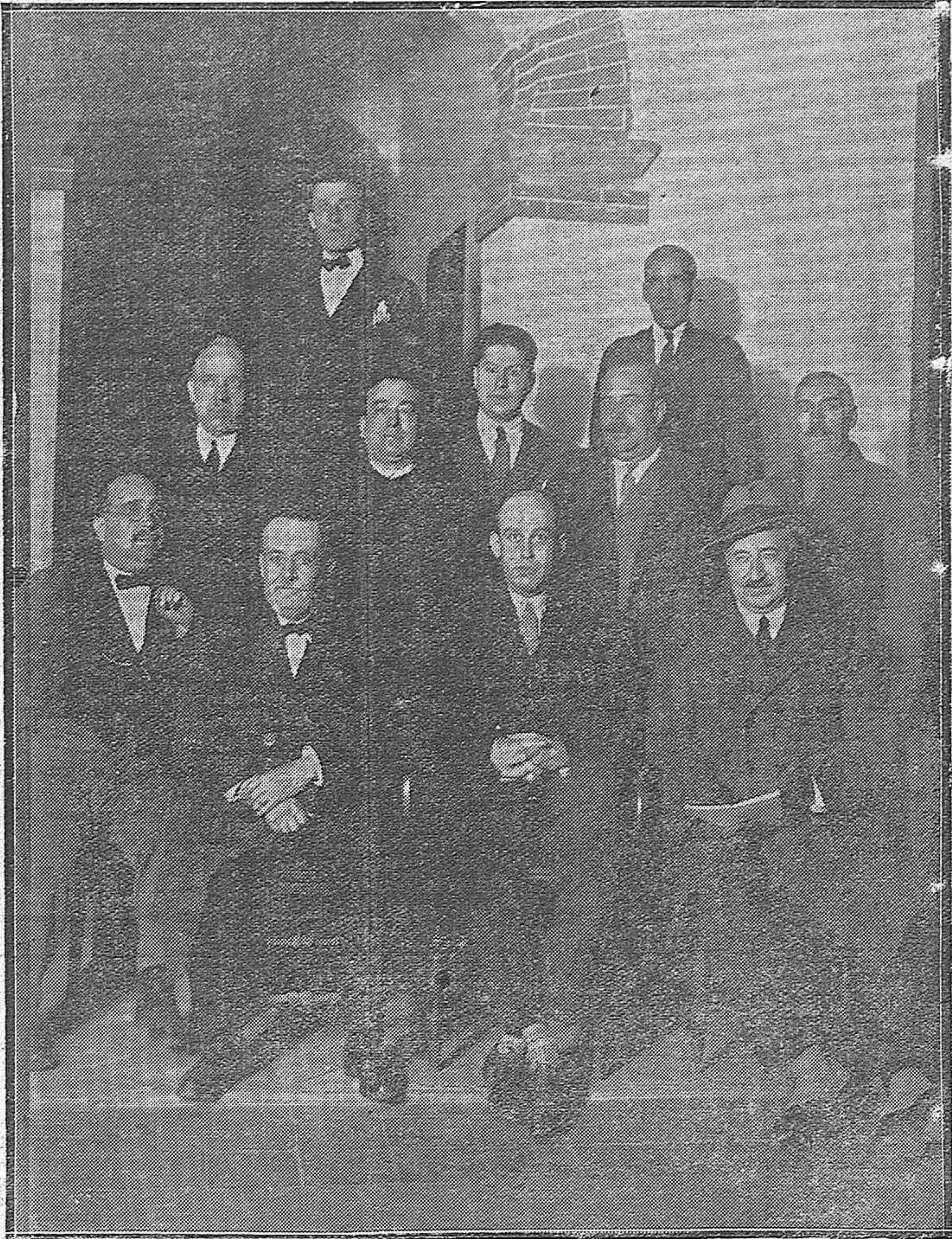
NUEVA SOCIEDAD.—La Junta organizadora de la Asociación de inquilinos de esta capital.