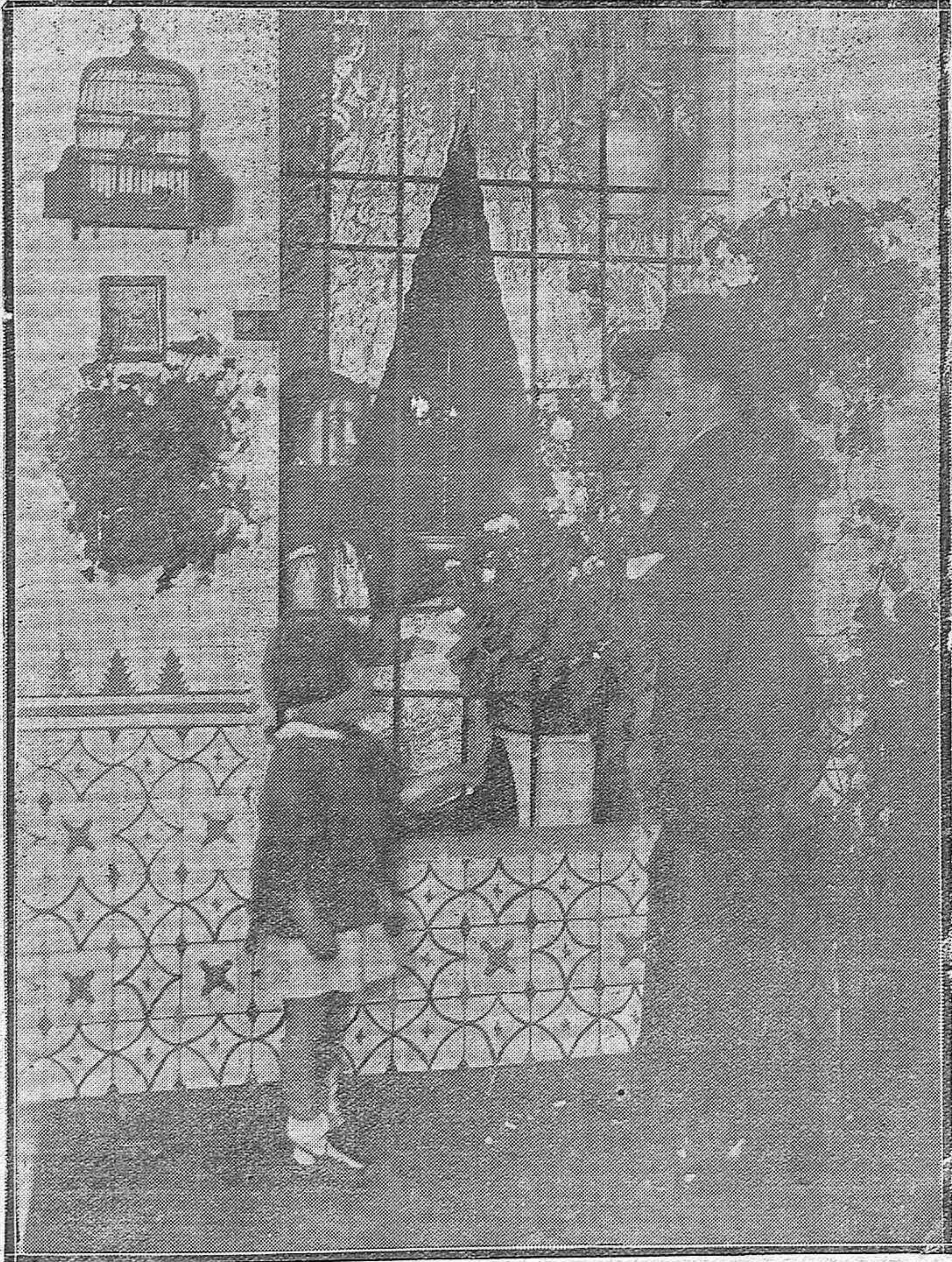
ESCENAS CORDOBESAS.—Un idilio interrumpido por una preciosa niña que pide limosna por el amor de Dios.