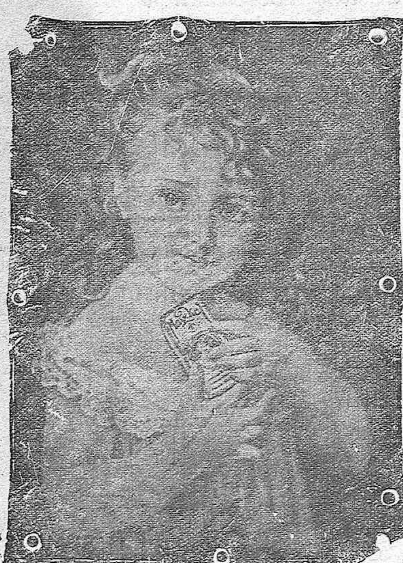
"La niña del Maizkal"