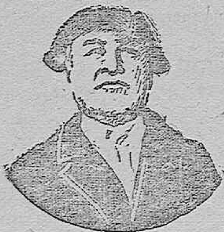
El genial humorista ruso. Arkadi Avertchenko

—Luego él morirá víctima del delirio alcohólico, junto a los niños aterrados y temblorosos. Y ellos, horrorizados, mirarán