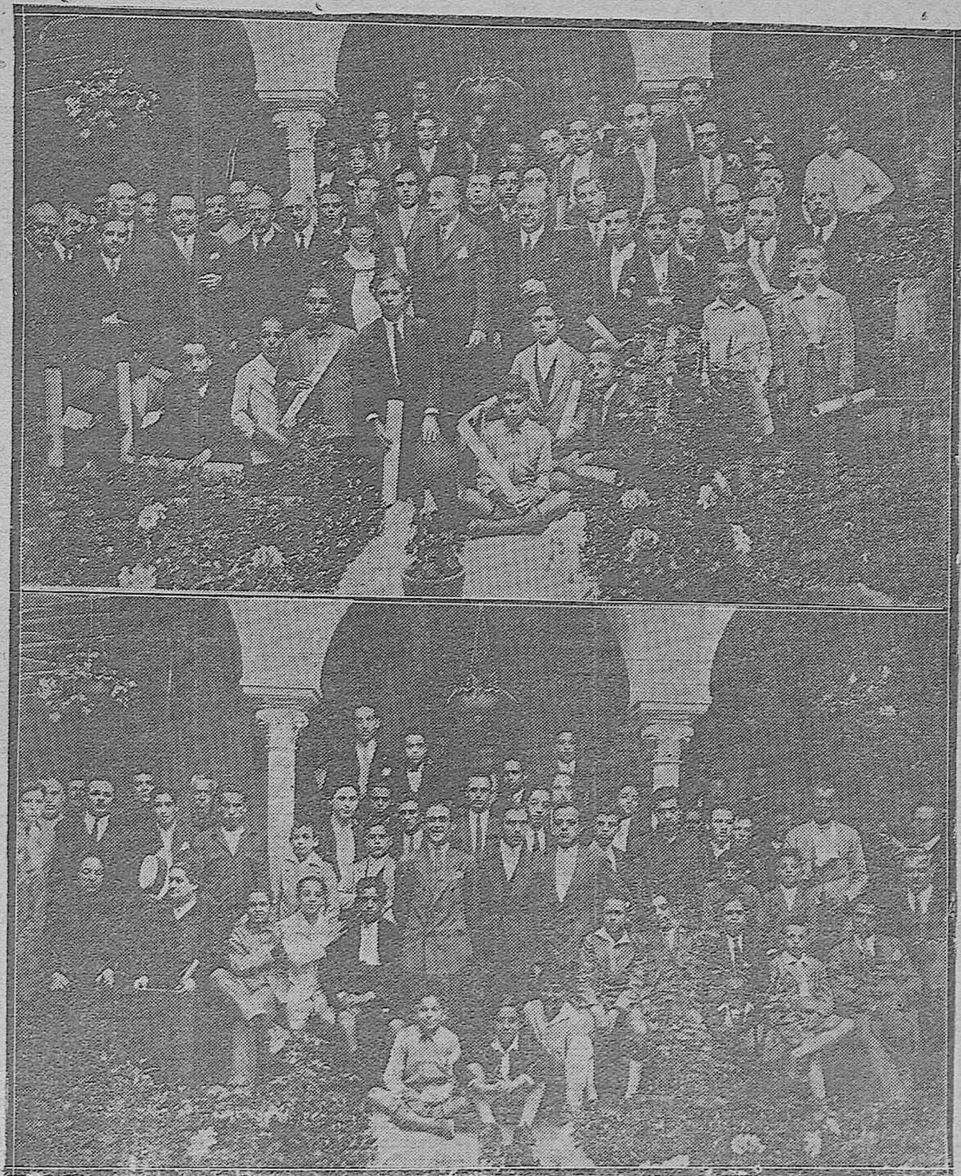
EN LA ESCUELA INDUSTRIAL.—El Gobernador civil, con el Delegado regio e inspector de Industrias de Sevilla, Claustro de profesores y alumnos diplomados.—Grupo de alumnos que recibieron los premios y becas