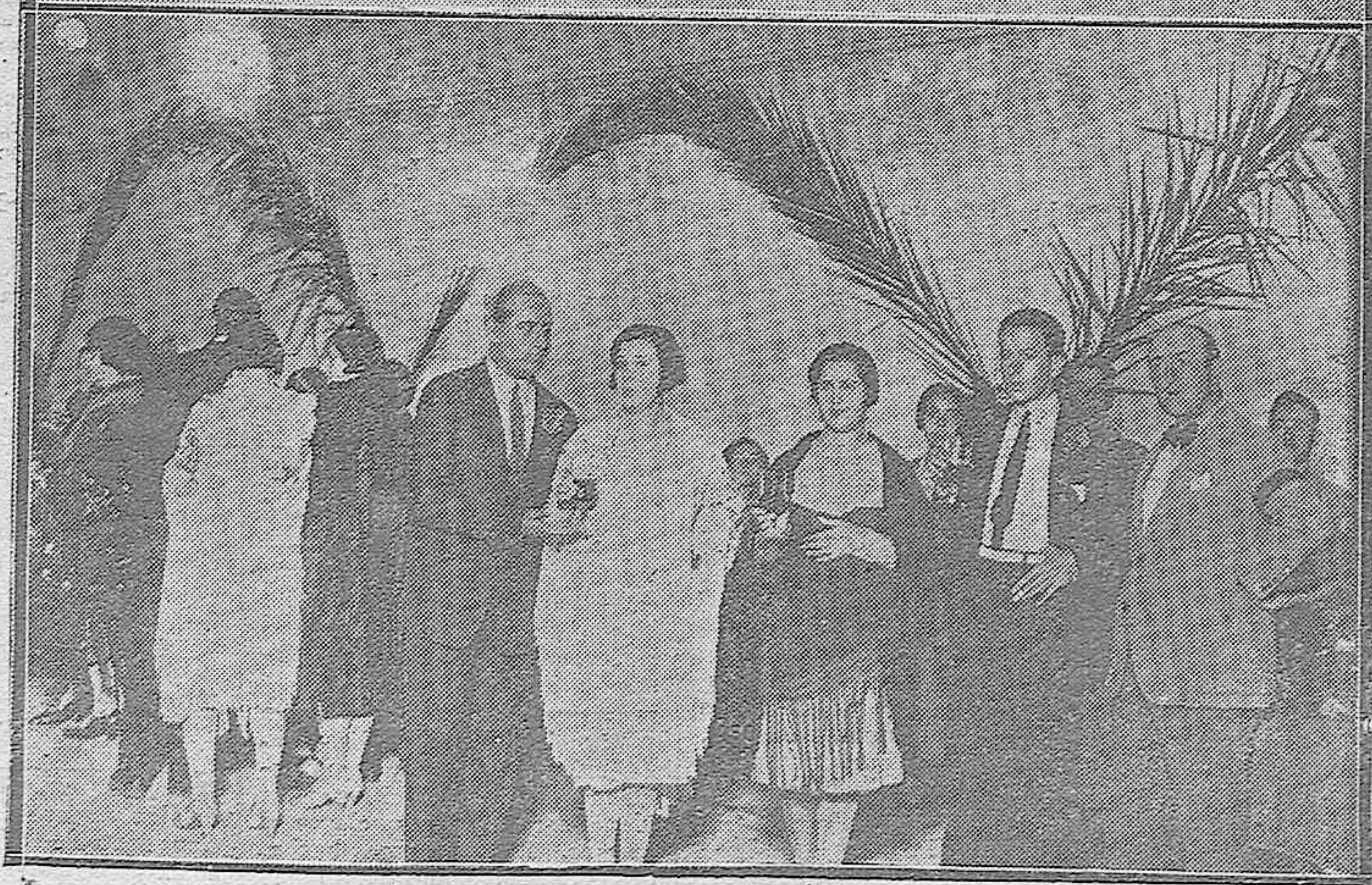
VERBENA ANDALUZA CELEBRADA EN EL CAMPO DE TENNIS.—Un «tio-vivo» ocupado por bellísimas muchachas.—Abajo: Refrescando en un improvisado puesto de cerveza.