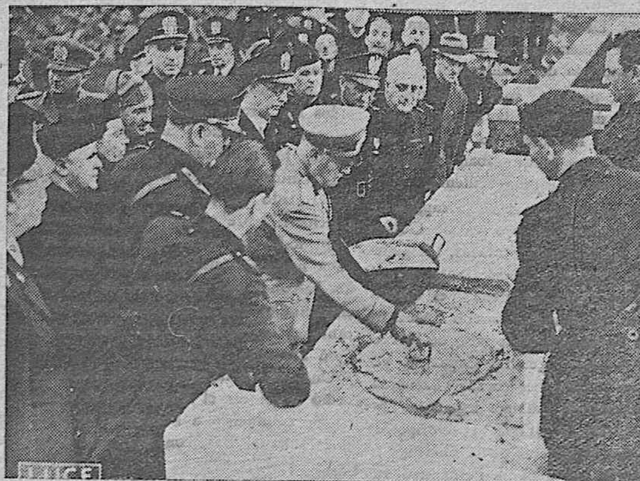
El Duce en la Vía Imperial visita los trabajos en curso y da comienzo a la construcción de otras obras.