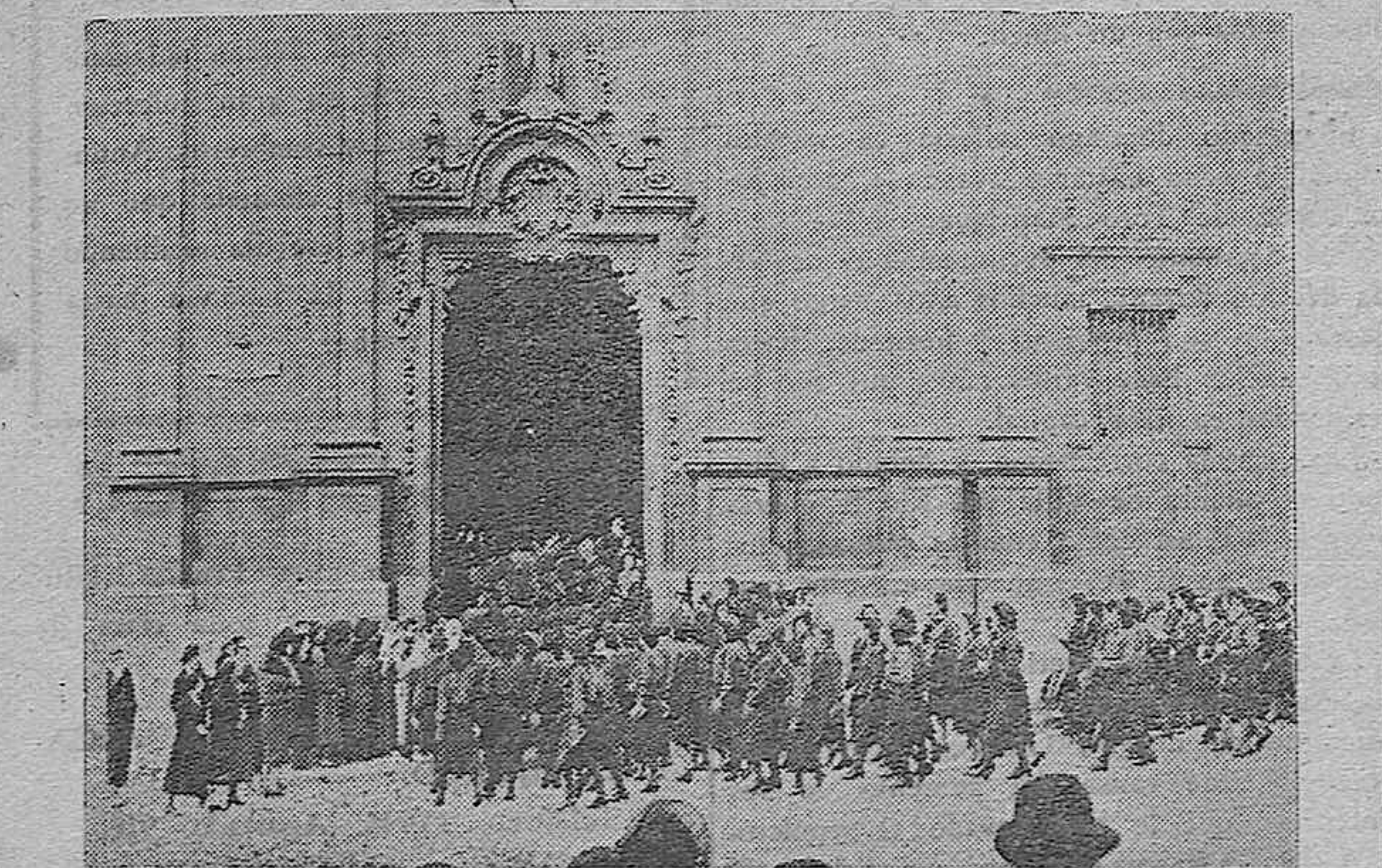
CONMEMORACION DE SANTA TERESA POR LA FALANGE FEMENINA.—Las Organizaciones Femeninas madrileñas han celebrado varios actos religiosos en la Iglesia de los Benedictinos de Madrid. Hélas aquí entrando.

El sacrificio que se demanda es mínimo, y el Gobierno espera, en su decisión de abrir un cauce de excepción, que la Ley quedará en definitiva reducida por el asentimiento tácito de los tenedores a una pura expresión de la delicadeza con el que el Estado conduce la política de deuda.»