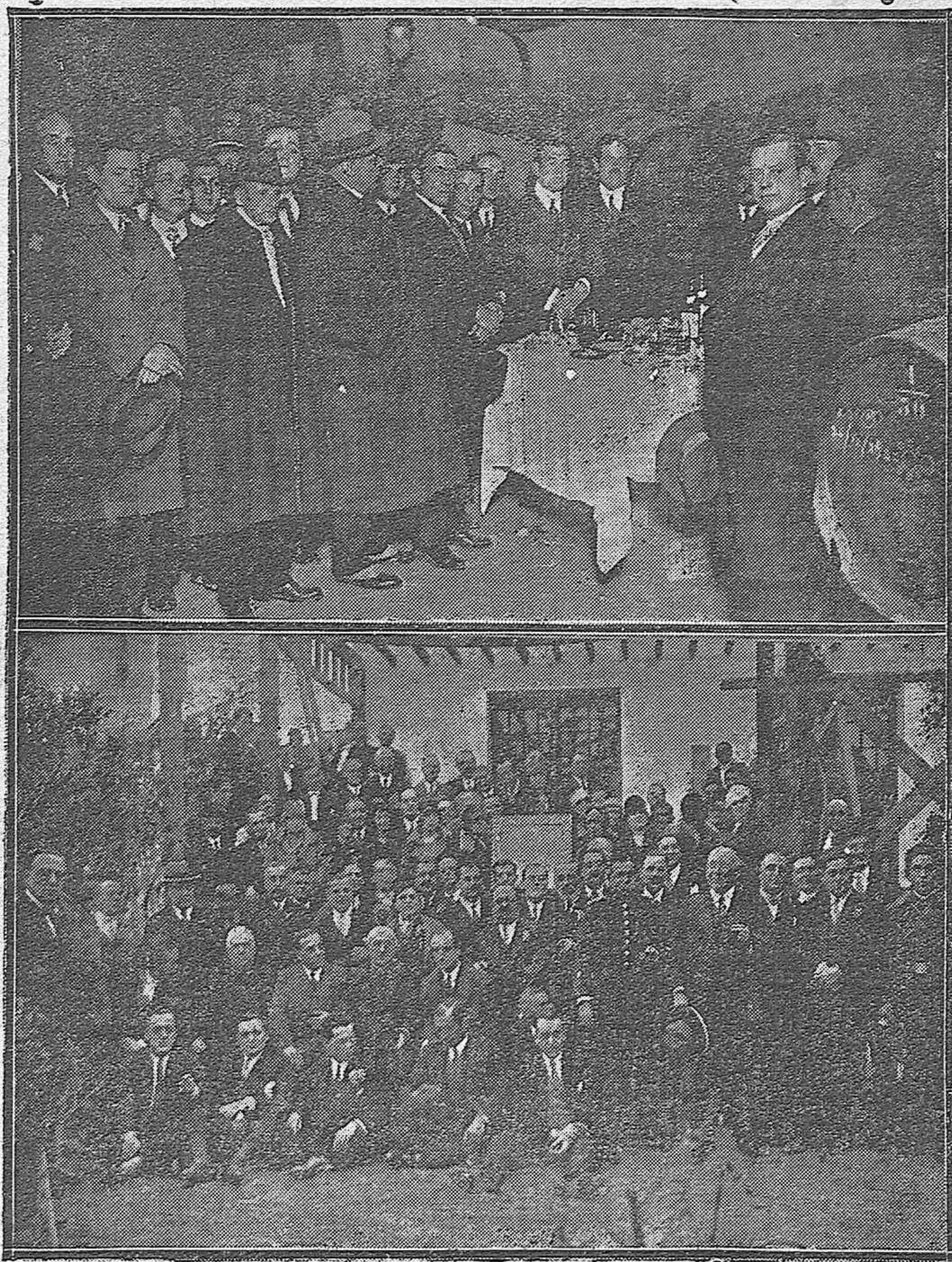
Los granadinos residentes en Córdoba y los excursionistas llegados de Granada visitando las grandes bodegas de Cruz Conde, donde fueron obsequiados con un espléndido lunch.— Grupo de asistentes al banquete que tuvieron en el Hotel Regina.