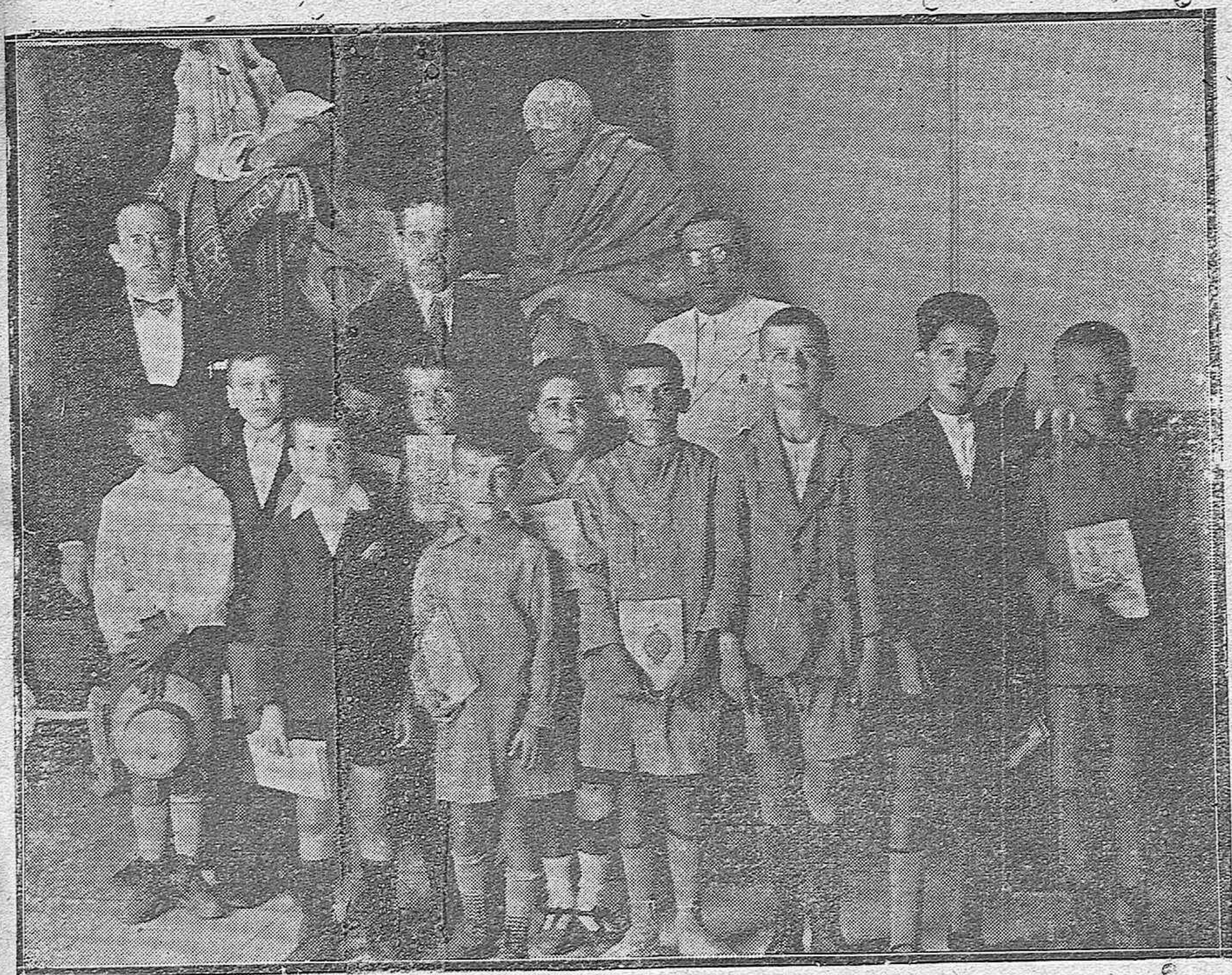
El Alcalde don Rafael Cruz Conde en la clausura del cursillo de Historia de Córdoba, dado a una selección de niños de las Escuelas Nacionales.