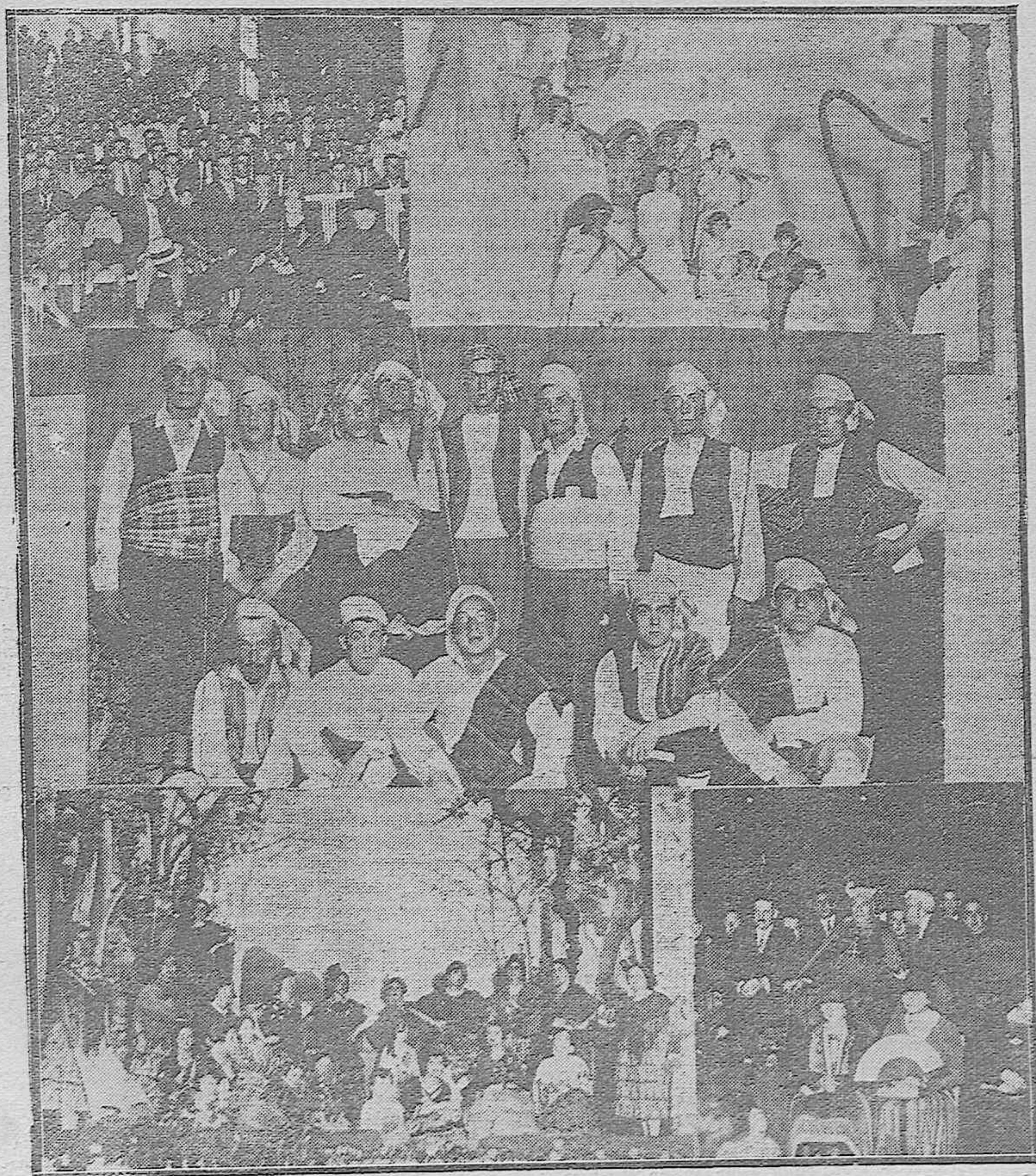
EN LAS CATEQUISTAS.—Fiesta con motivo de la terminación de las clases para obreros.—Aspecto del salón durante eracto.—Cuadro plástico la Visión de Santa Cecilia.—Baturros que cantaron algunas jotas.—Cuadro plástico Campamento Gitano.—Presidencia de Honor.