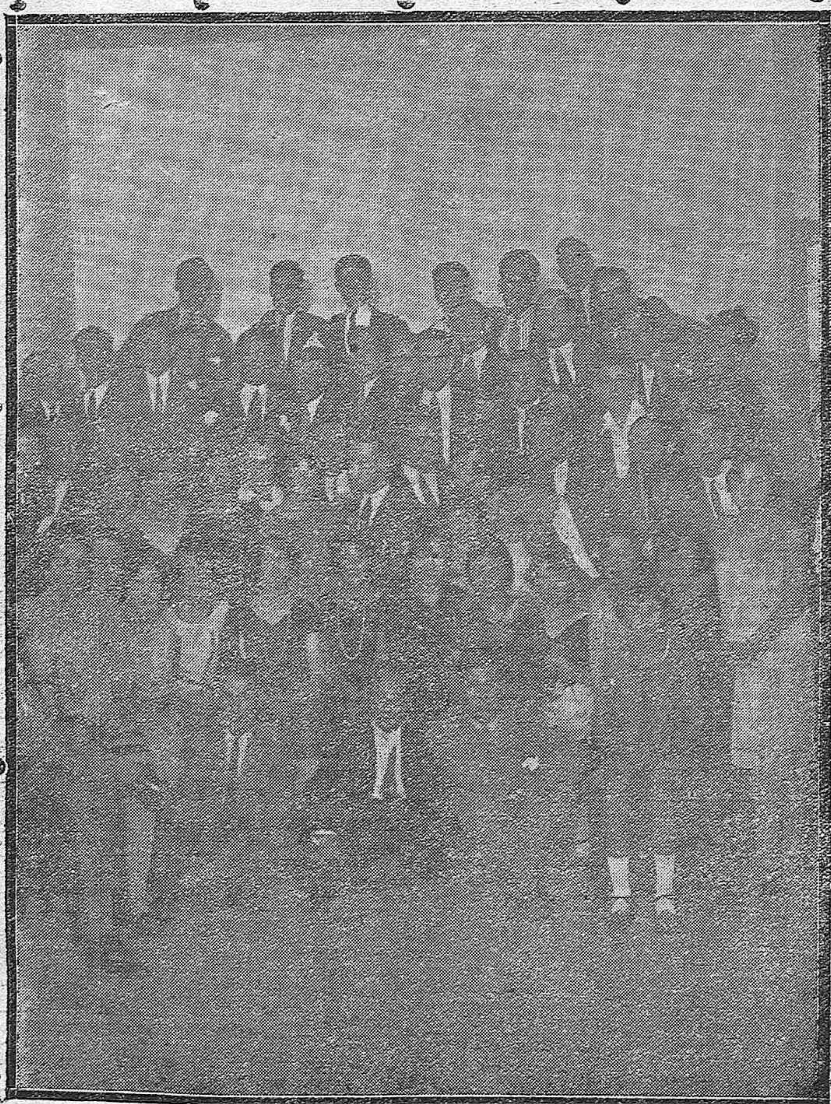
Concurrentes a la verbena celebrada por la sociedad «Unión Mercantil», de la calle Múfices.