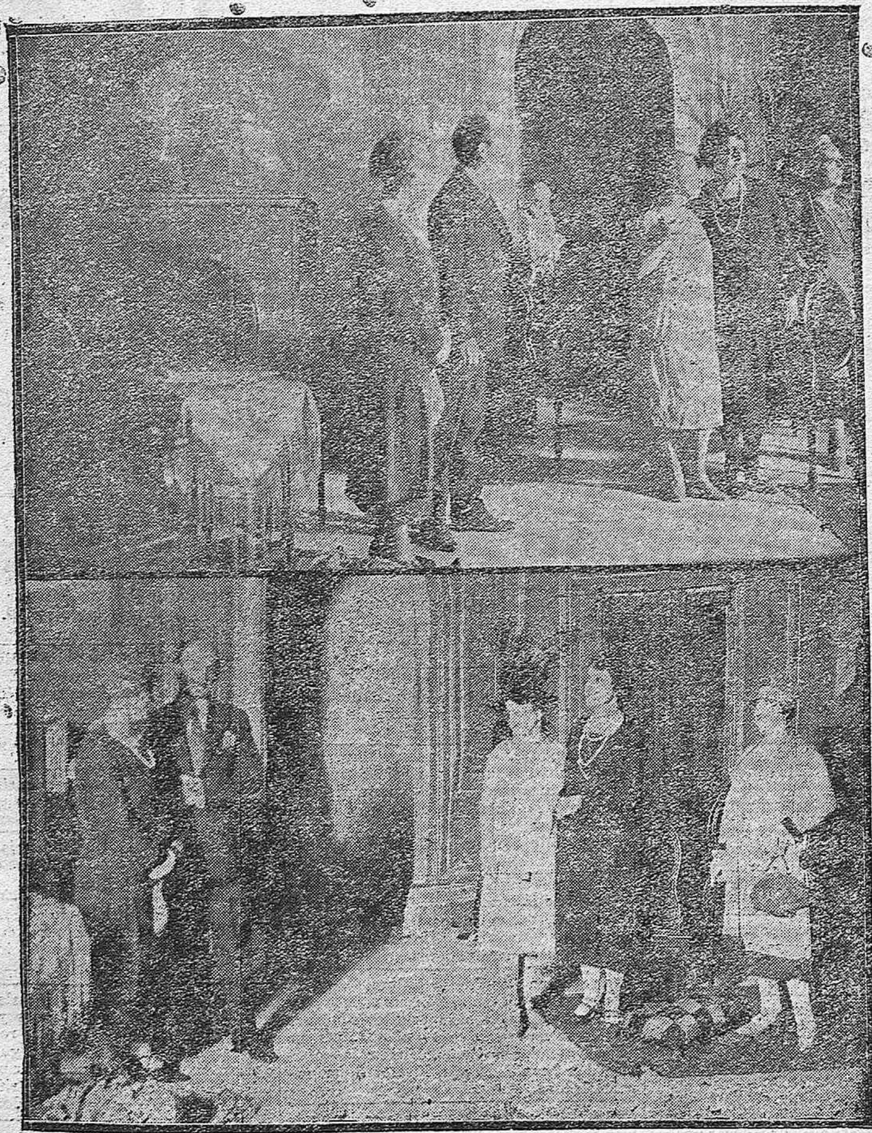
Dos escenas de la comedia «La ilustre dama», original del escritor cordobés don Antonio Jiménez Lora, estrenada con éxito en el Gran Teatro.