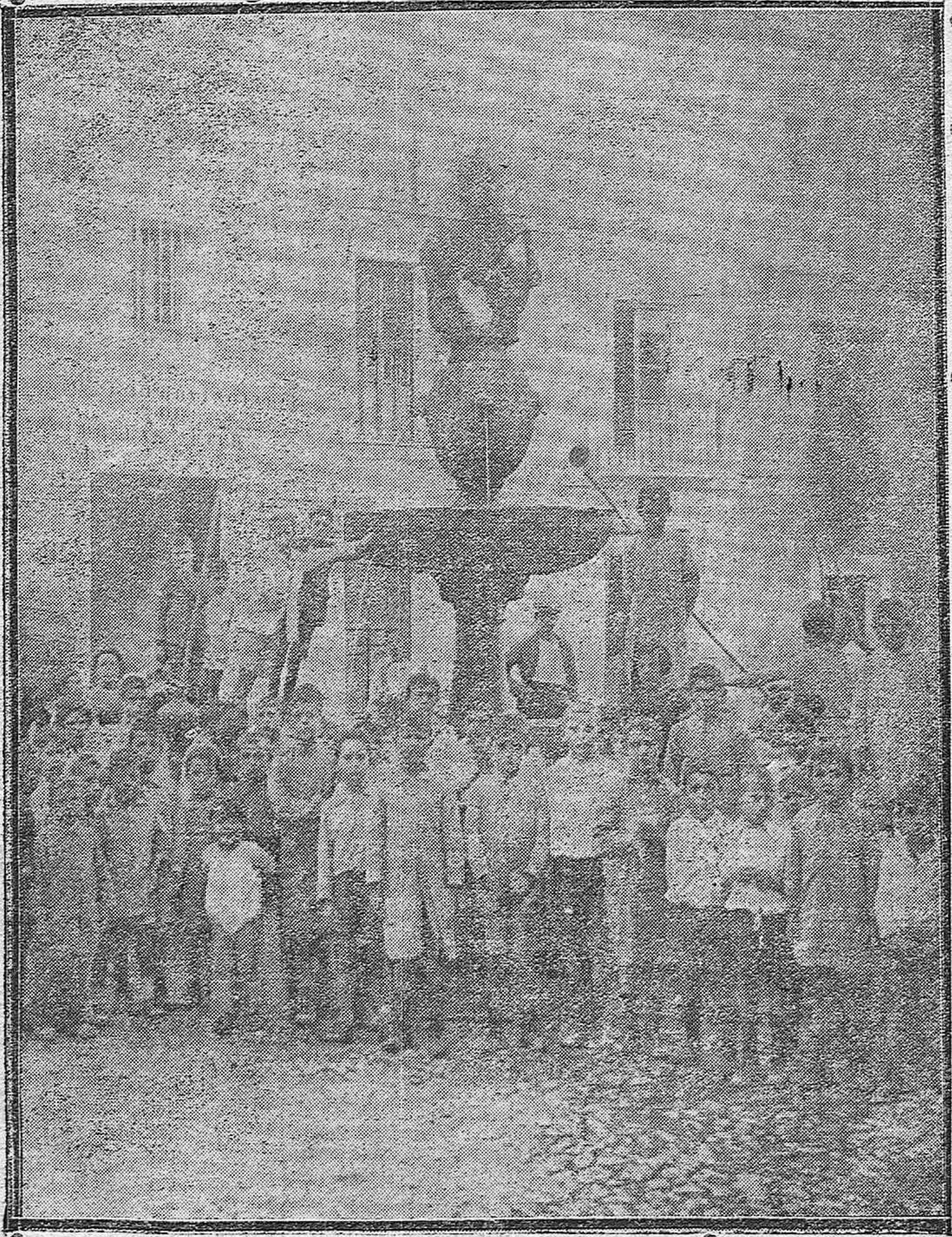
EL DÍA DEL LIBRO.—Alumnos de las escuelas visitando el histórico paraje del Potro, citado por Cervantes en «El Quijote».