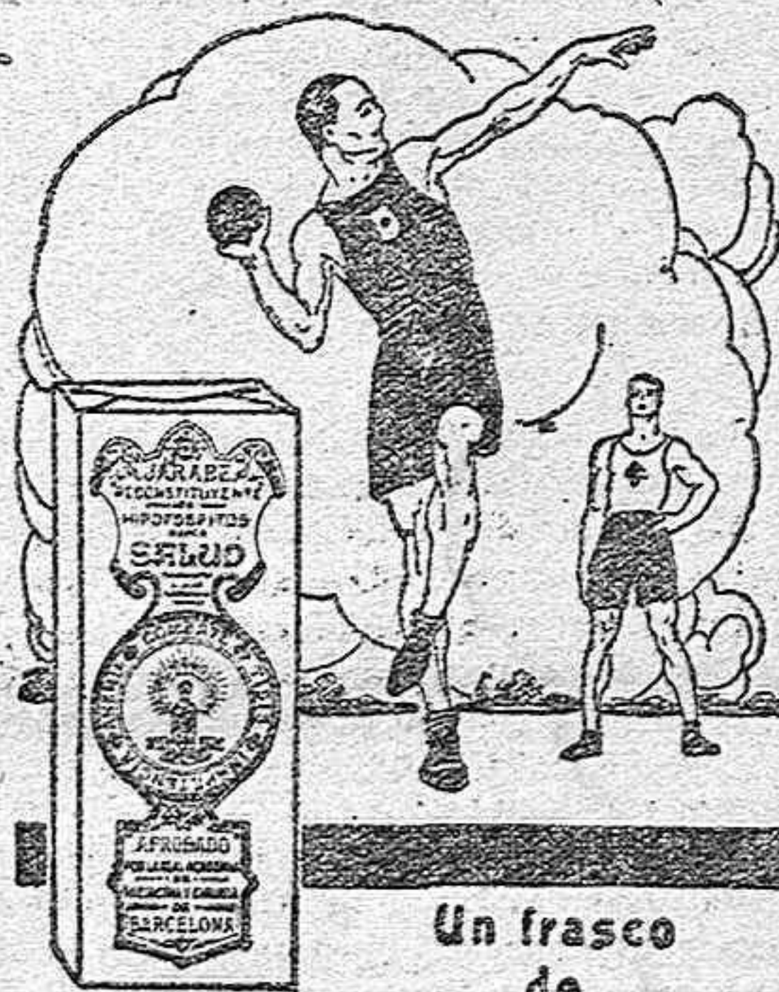
Un frasco de

Corie de María. —Las antiguas usajadas y las personas devotas de la Virgen visitarán en este día 2, sábado, a Nuestra Señora de Belén en San Miguel.