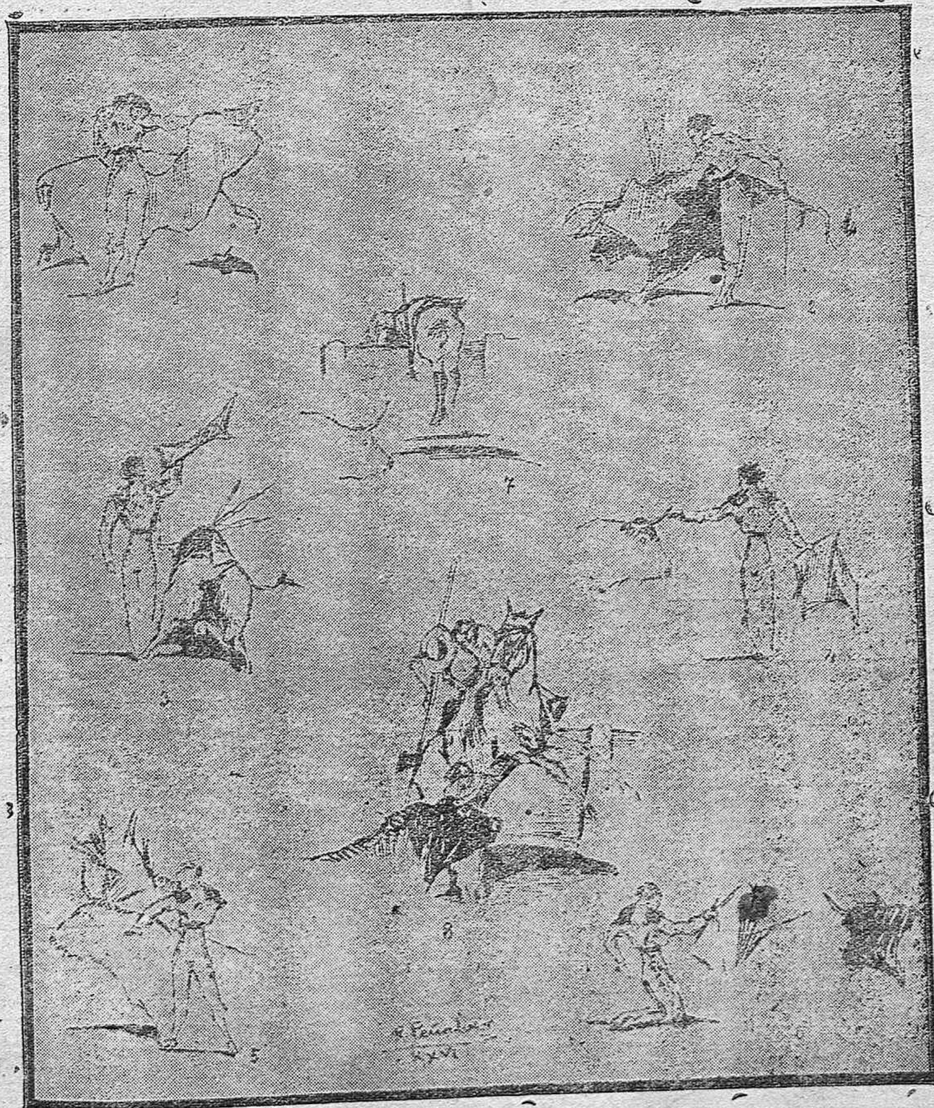
De la novillada de Feria.—1, 2) El Palmeño.—3, 4) Félix Rodríguez.—5, 6) Cantimplas.—7) Un seguridad que perdió la «idem».—8) Una buena vara de Garnago al sexto. (Apuntes tomados del natural por Rafael Penabaz.)