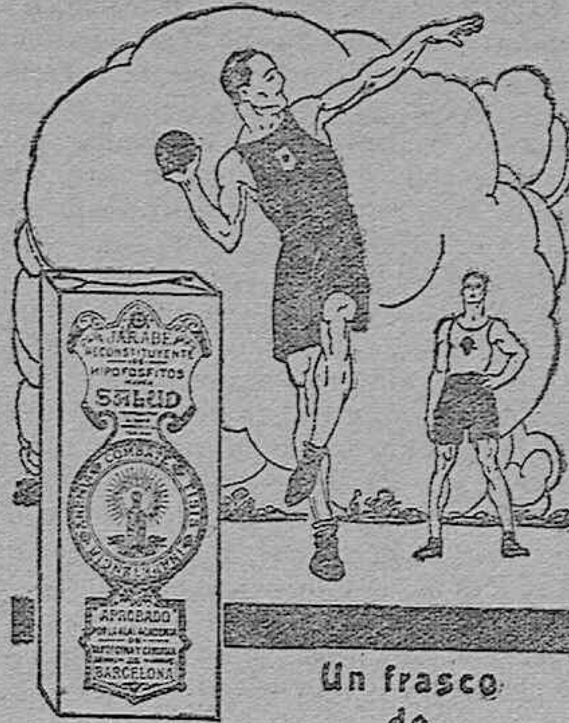
Un frasco de