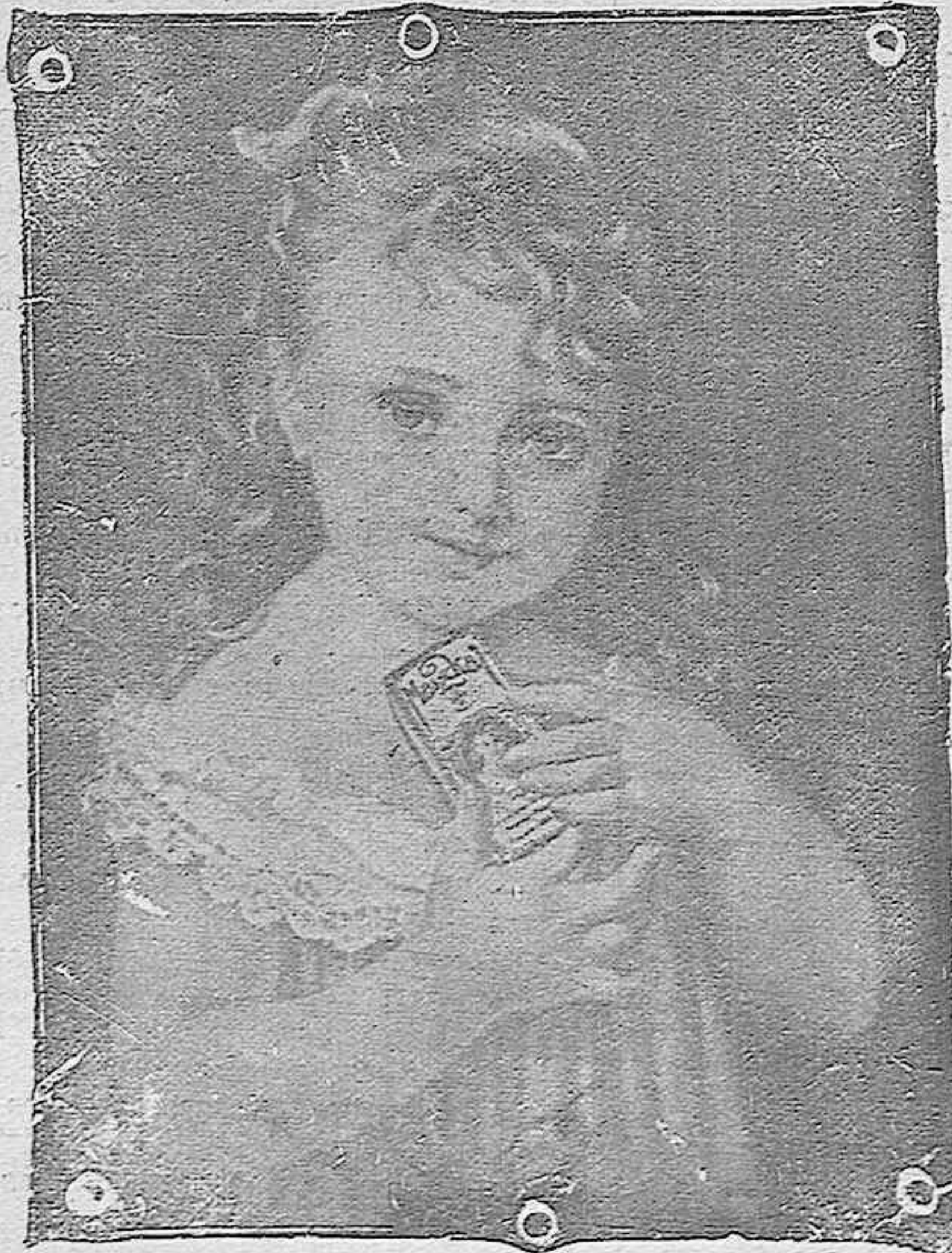
“La niña del Maizkal”

GAMUZAS y artículos para batas en EL METRO y sus tres Sucursales, gran surtido a precios de ganga.