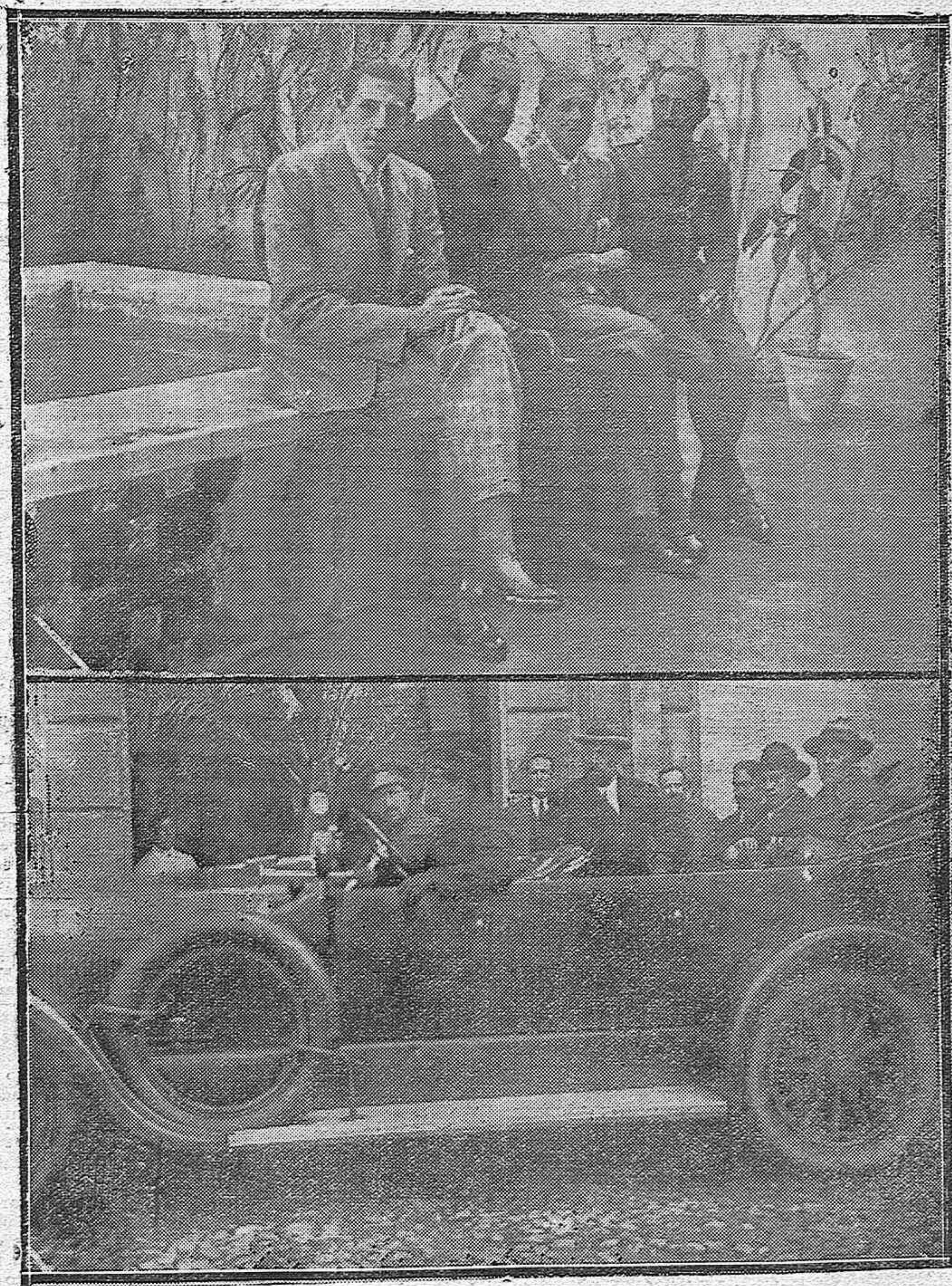
EL PRÍNCIPE DE ASTURIAS Y EL INFANTE DON JAIME EN CORDOBA.—Los augustos viajeros descansando en el palacio del marqués de Viana, acompañados del gobernador civil de Sevilla don José Cruz Conde.—El Príncipe y el Infante al llegar al Museo de Bellas Artes, que estuvieron visitando.