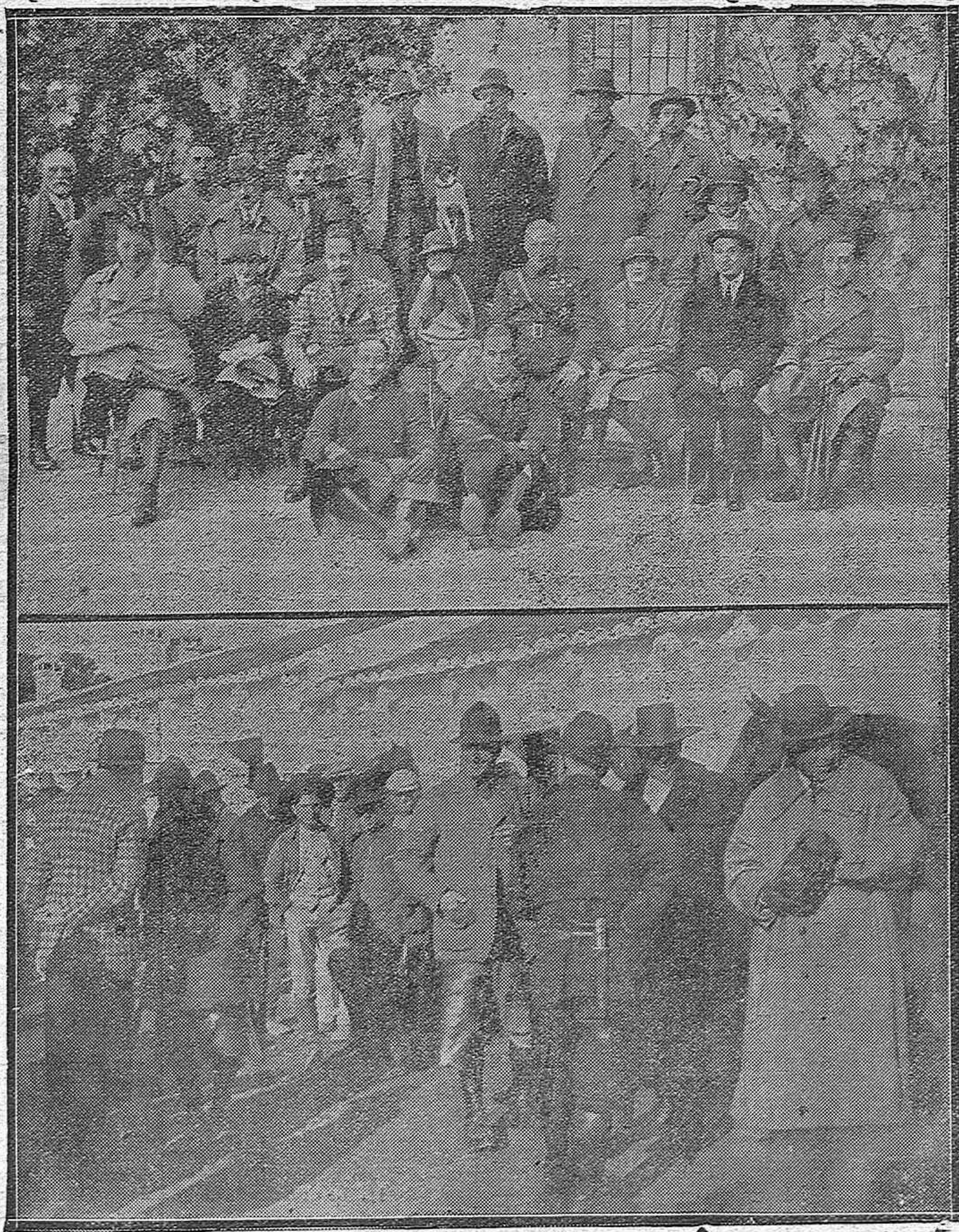
Don Alfonso XIII, general Primo de Rivera, ministro de Estado, príncipe de Razinville e ilustres aristócratas-monteros, en el palacio de Moratalla, antes de salir para la montería del «Rincón». Grupo organizado expresamente a nuestro reporter gráfico señor Santos.—El popular «Guerrita» dispuesto para montar en el «Rincón».