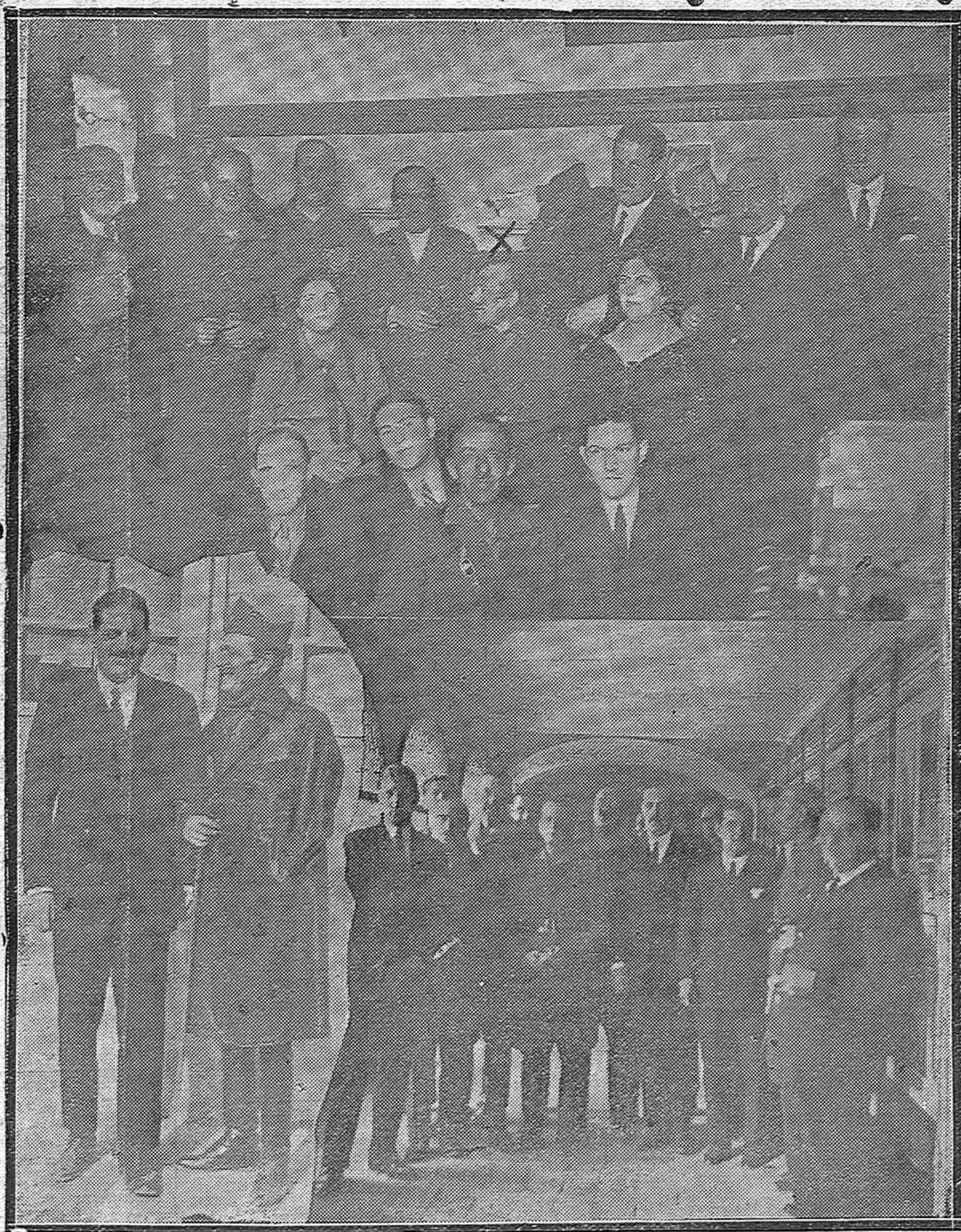
EL CORONEL MILLÁN ASTRAY EN CÓRDOBA.—Varios momentos interesantes de la estancia en esta capital del heroico jefe de la Legión y de sus bizarros acompañantes.