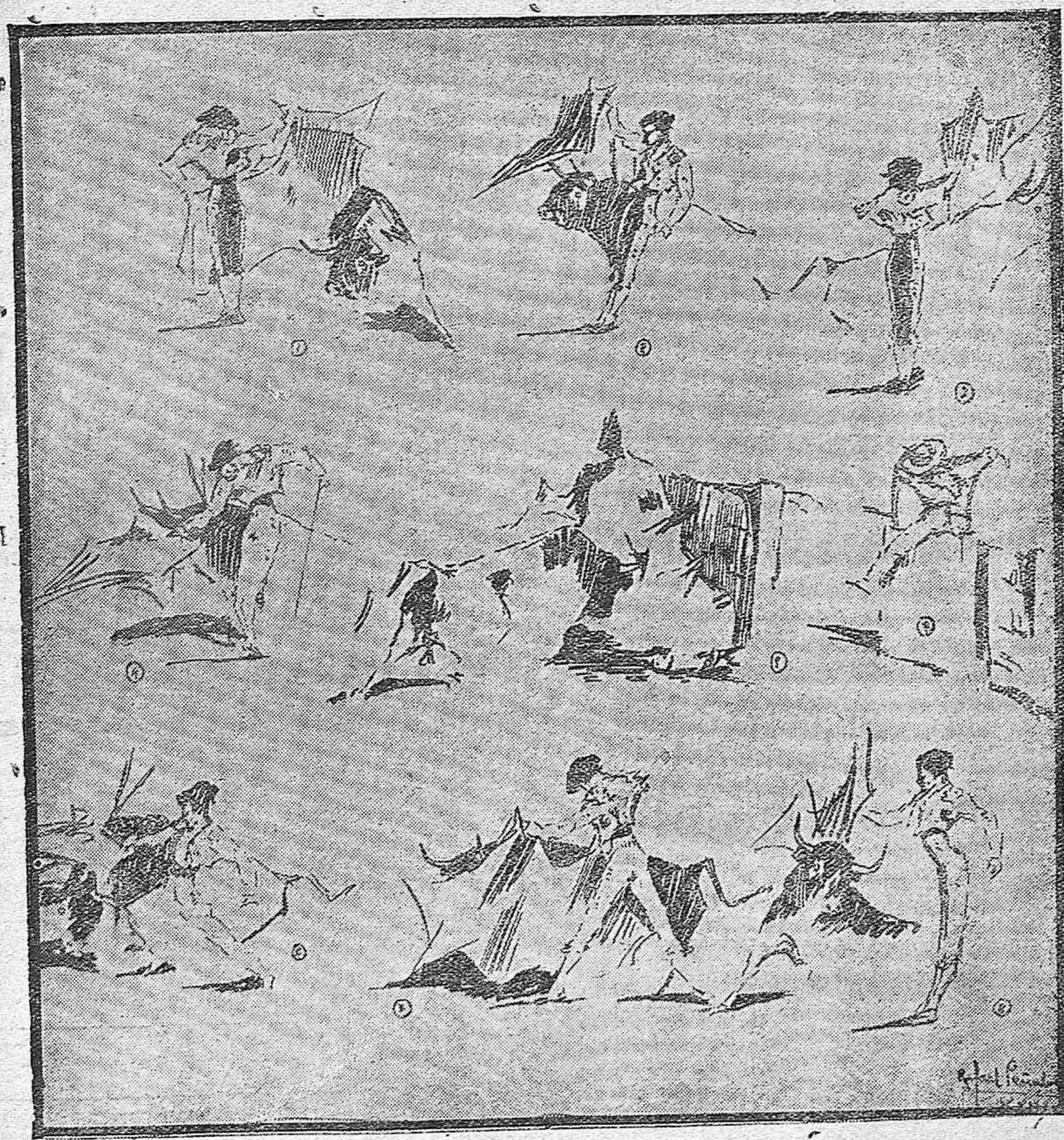
1, 2, 3, 4) Pérez Soto en su segundo novillo.---5) El toro cuarto recargado con poder al caballo de un picador a la salida del chiquero.---6) Delmonte en un mulotazo medio de rodillas.---7, 8) Matías García en su primero.---9) La nota cómica de la corrida; apuntes al natural por Rafael Peñalver.