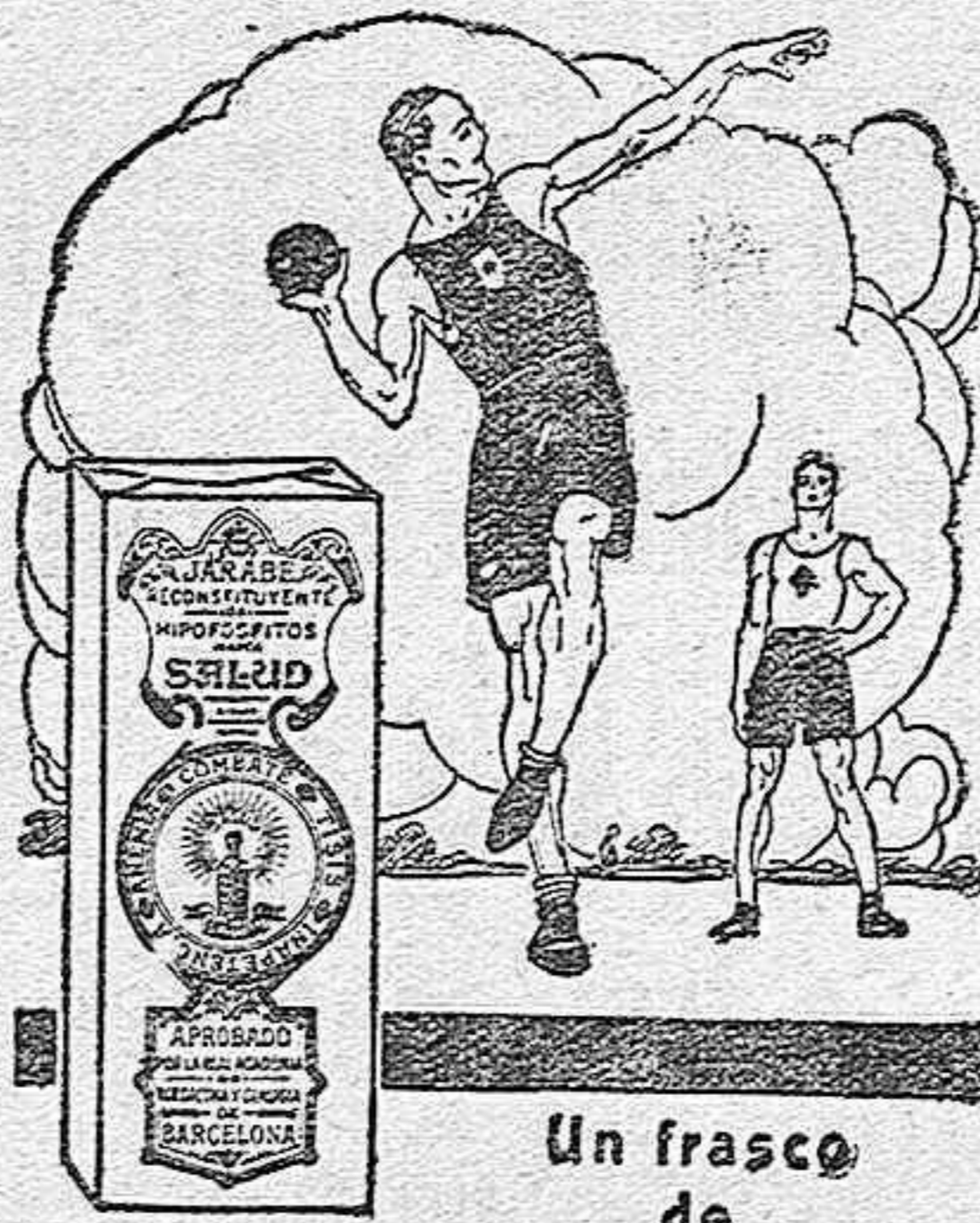
Un frasco de