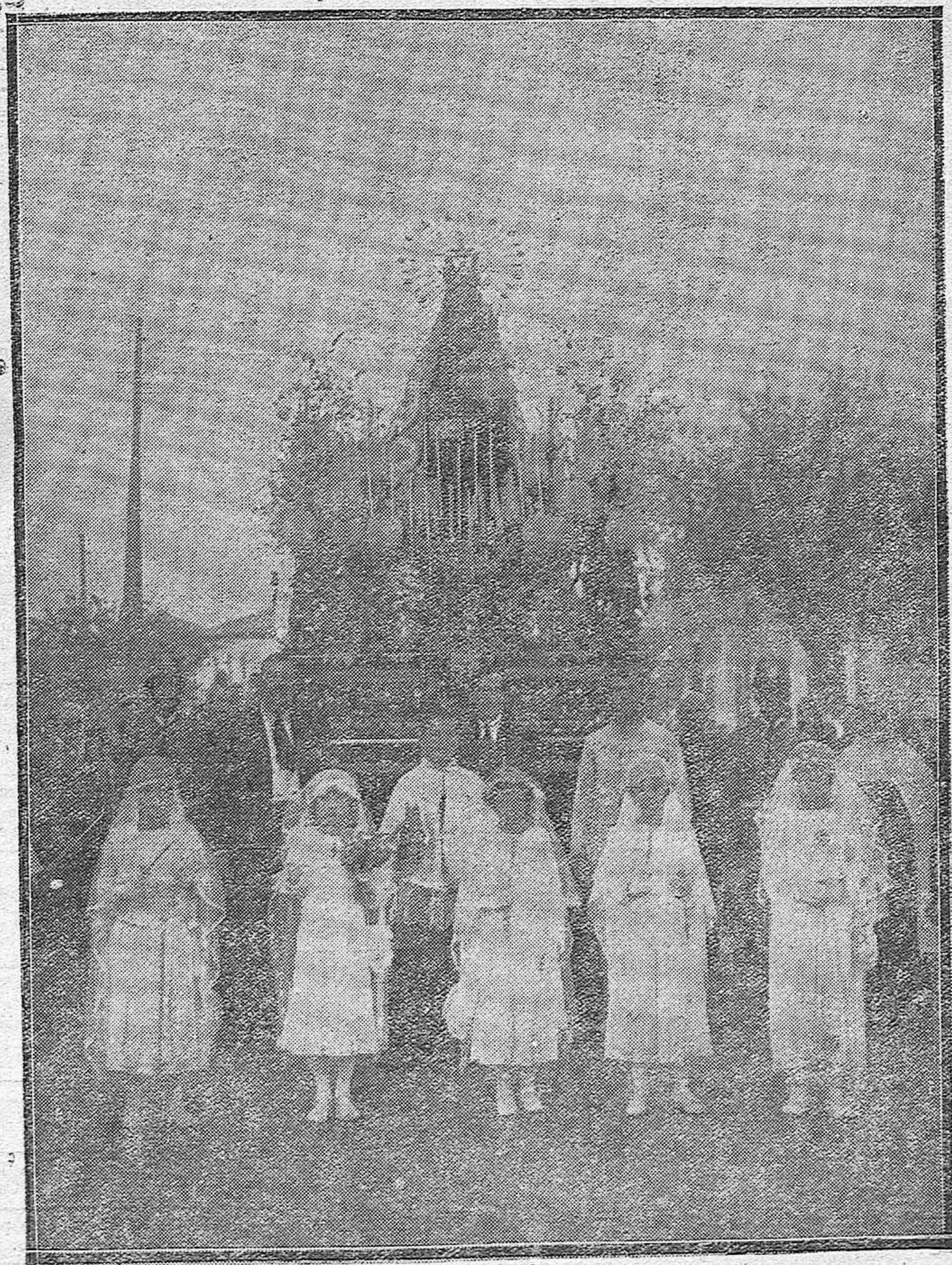
Le imagen de la Virgen del Carmen que fué sacada anoche en procesión de la iglesia de San Cayetano.