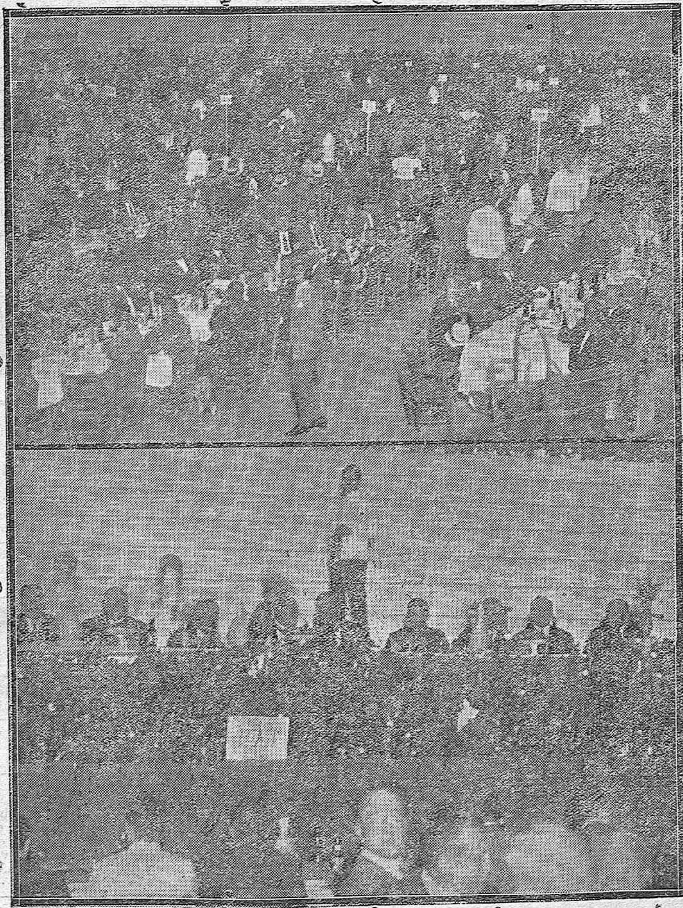
EL BANQUETE OLIVARERO DE AYER.---Mesa presidencial del banquete.---Un aspecto de la Plaza de Toros durante el acto.