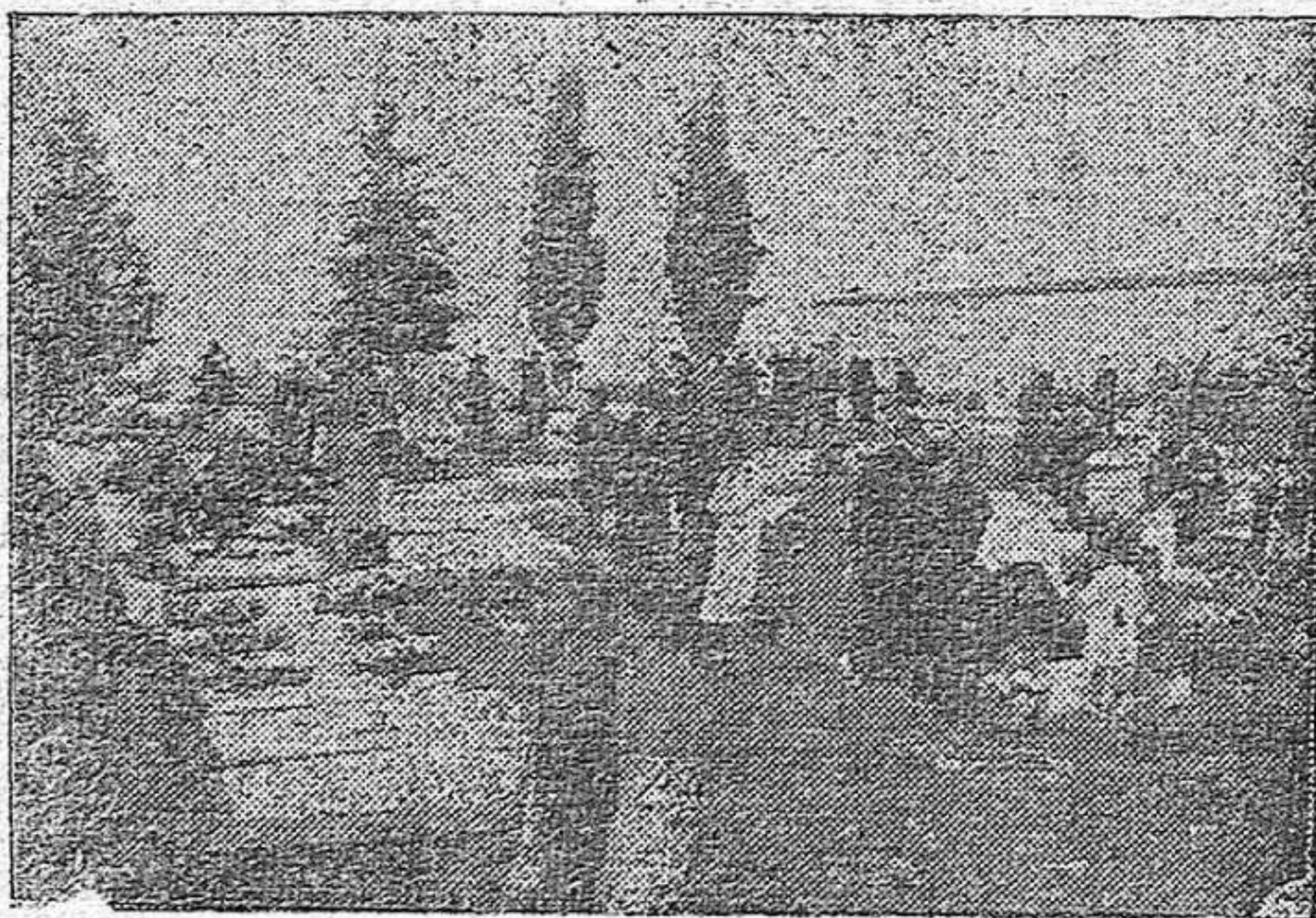
Cruces, cipreses y oraciones sobre las tumbas de los que entraron en la eternidad.

La Cruz lo es todo en el cementerio. ¡Maldita la mano sacrilega que se atreva a arrancarla de la tumba de nuestros padres, que ha de ser algún día la nuestra! ¡Cementerio sin cruz, no fuera Cementerio, que en la palabra cristiana, significa lugar de sueño dulce del cual se es para despertar! Cementerio sin cruz, sería simplemente un «puéridero» de cadáveres, puesto por la policía urbana lo más lejos posible de las poblaciones a fin de que los miasmas de los muertos, no envenenasen la respiración de los vivos. Cemen-