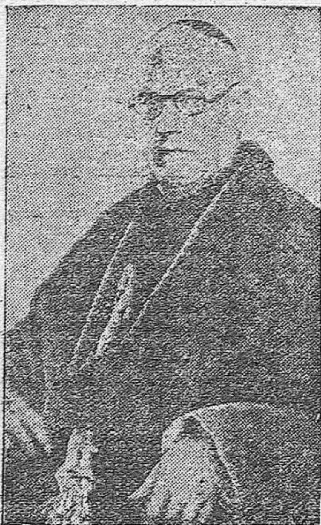
El Cardenal Primado, Dr. Gomá, cuya muerte llena hoy de dolor a la Iglesia y a España.

Un gran muchedumbre desfiló ante el féretro, colocado en el Salón de Concilios