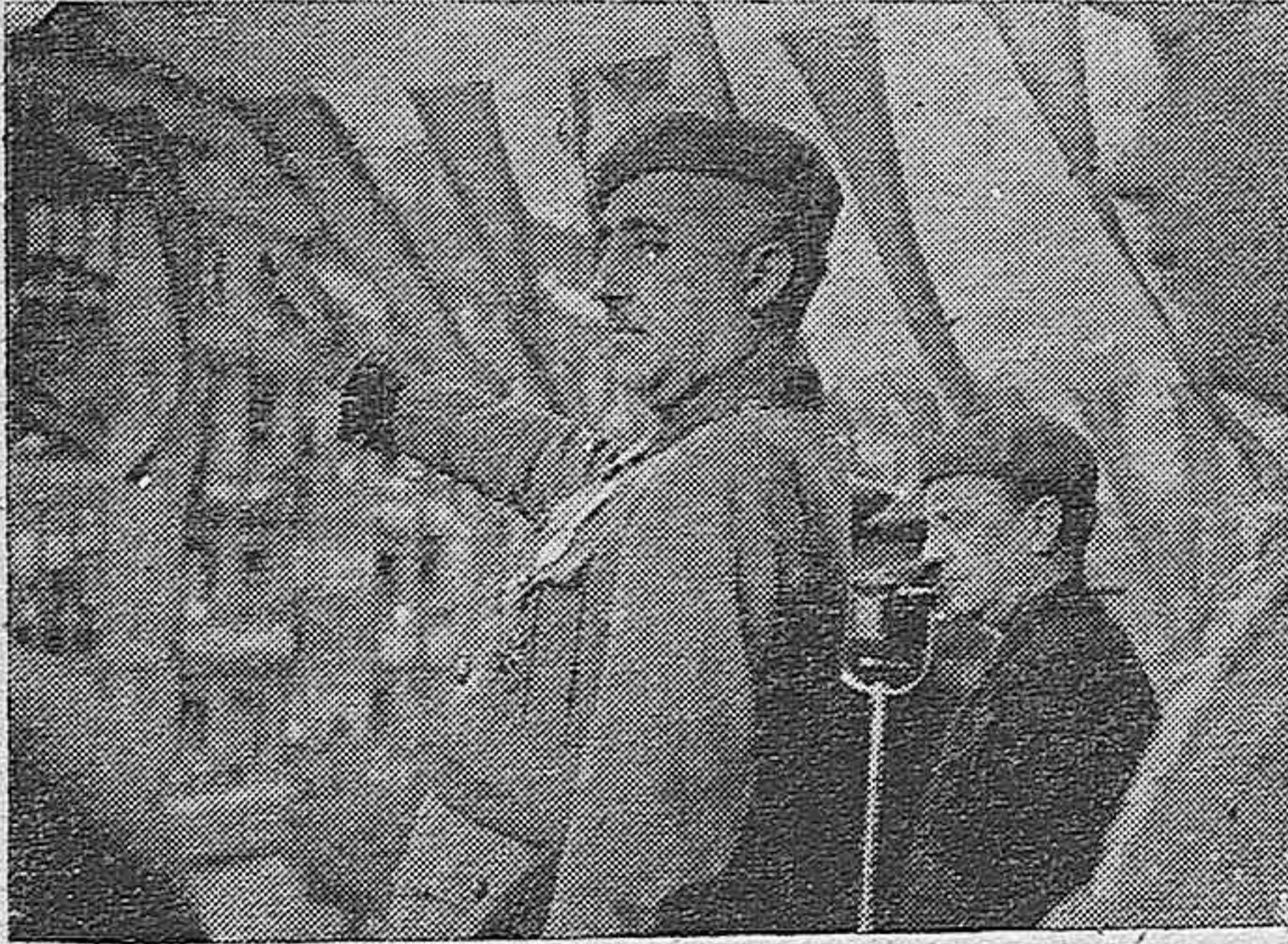
El Caudillo presenciando el desfile en las Fiestas del Segundo Aniversario de la liberación de Bilbao

Córdoba. - Domingo 25 de Junio de 1939 :-: Año de la Victoria :-: Número 845