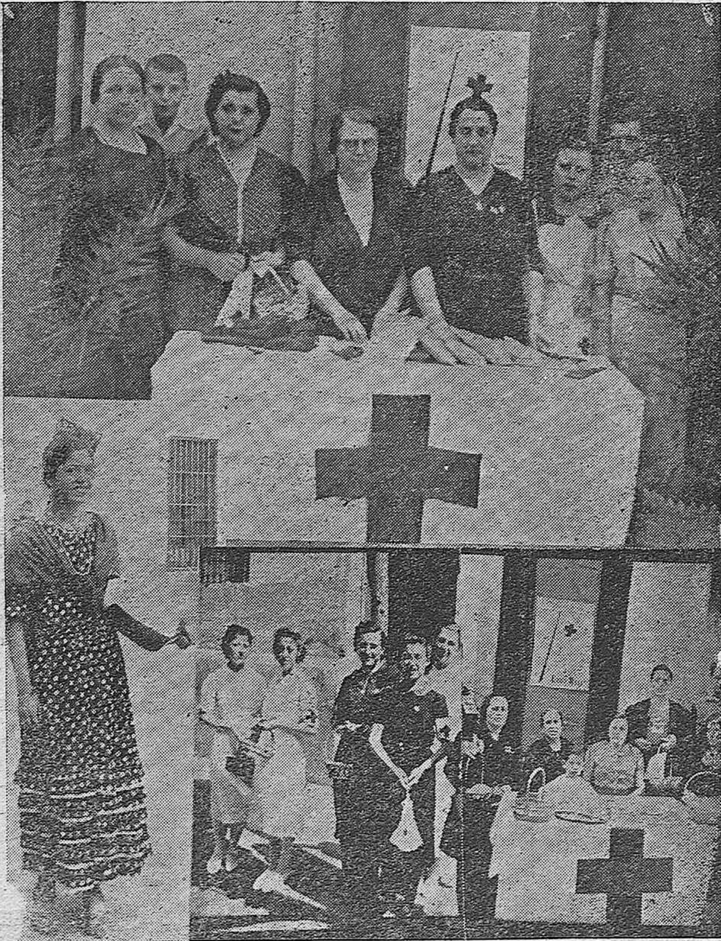
LA FIESTA DE «LA BANDERITA» EN CORDOBA.—Diversos aspectos de la fiesta de «La Banderita».—Me- sas peñitorias y postulantas a favor de la meritisima institución de la Cruz Roja.