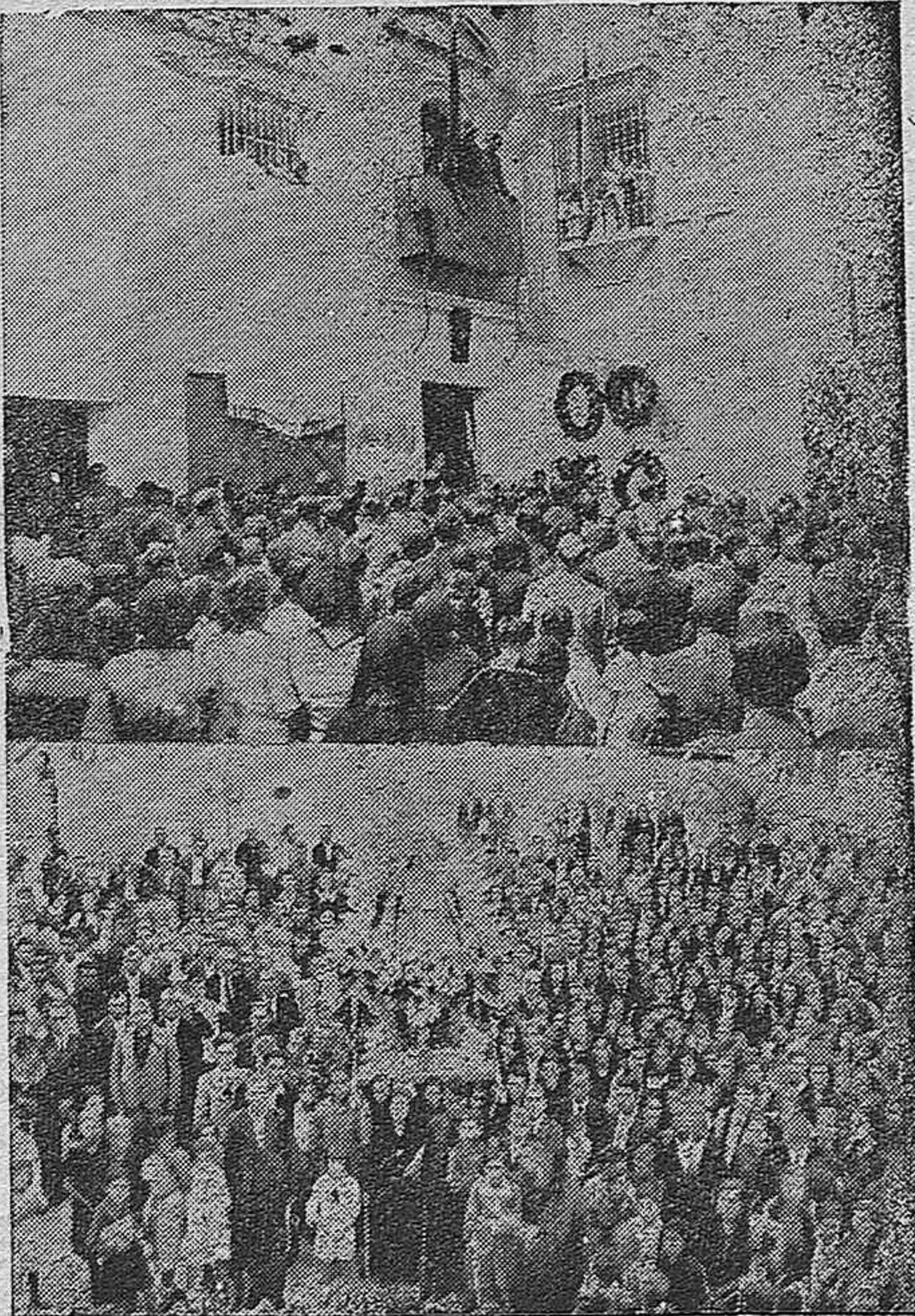
LOS ACTOS DE SANTAELLA.—Ante la Cruz de los Caídos se rinde homenaje a los héroes del Movimiento.—Procesión de Nuestra Señora del Valle, Patrona de Santaella.

Córdoba, 3 de Junio de 1939. Año de la Victoria.—El Jefe Provincial de la O. J.