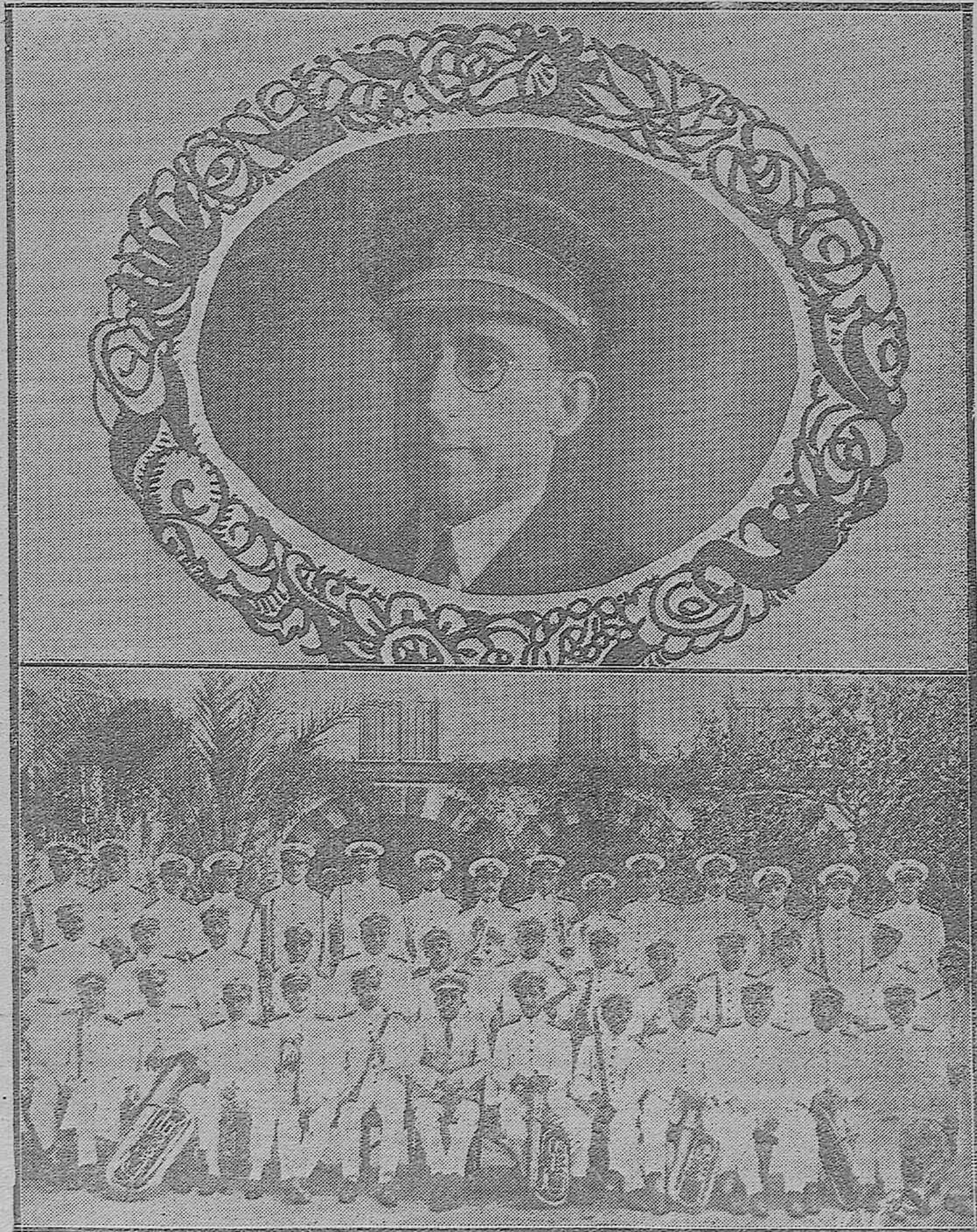
NUESTROS REPORTAJES.—El director y profesores de la Banda Municipal de Música posando ante el objetivo de nuestro reporter gráfico.