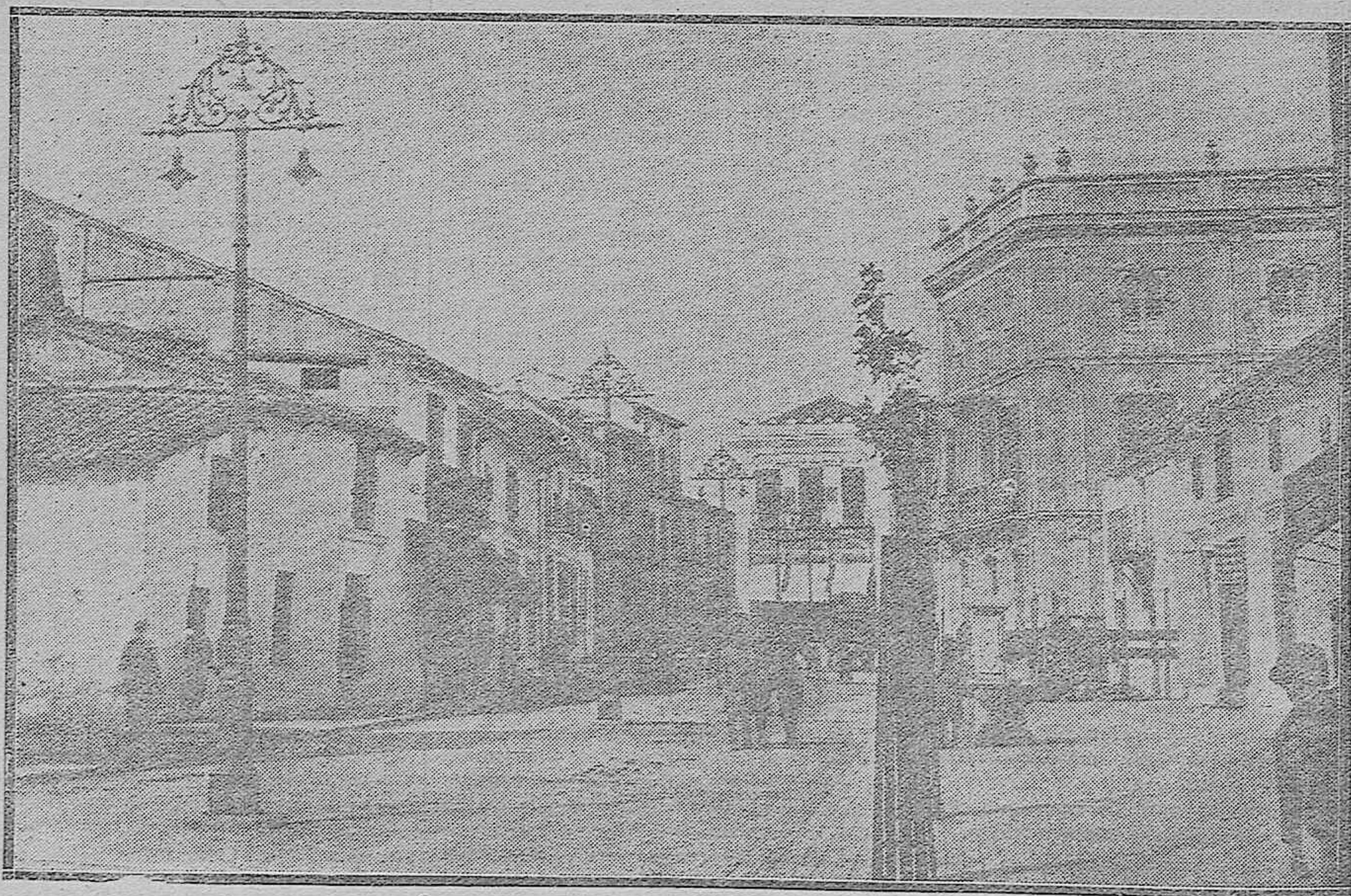
NUESTRA VISITA A LOS PUEBLOS.—POZOBLANCO: CALLE REAL, UNA DE LAS PRINCIPALES VIAS DE LA POBLACIÓN.