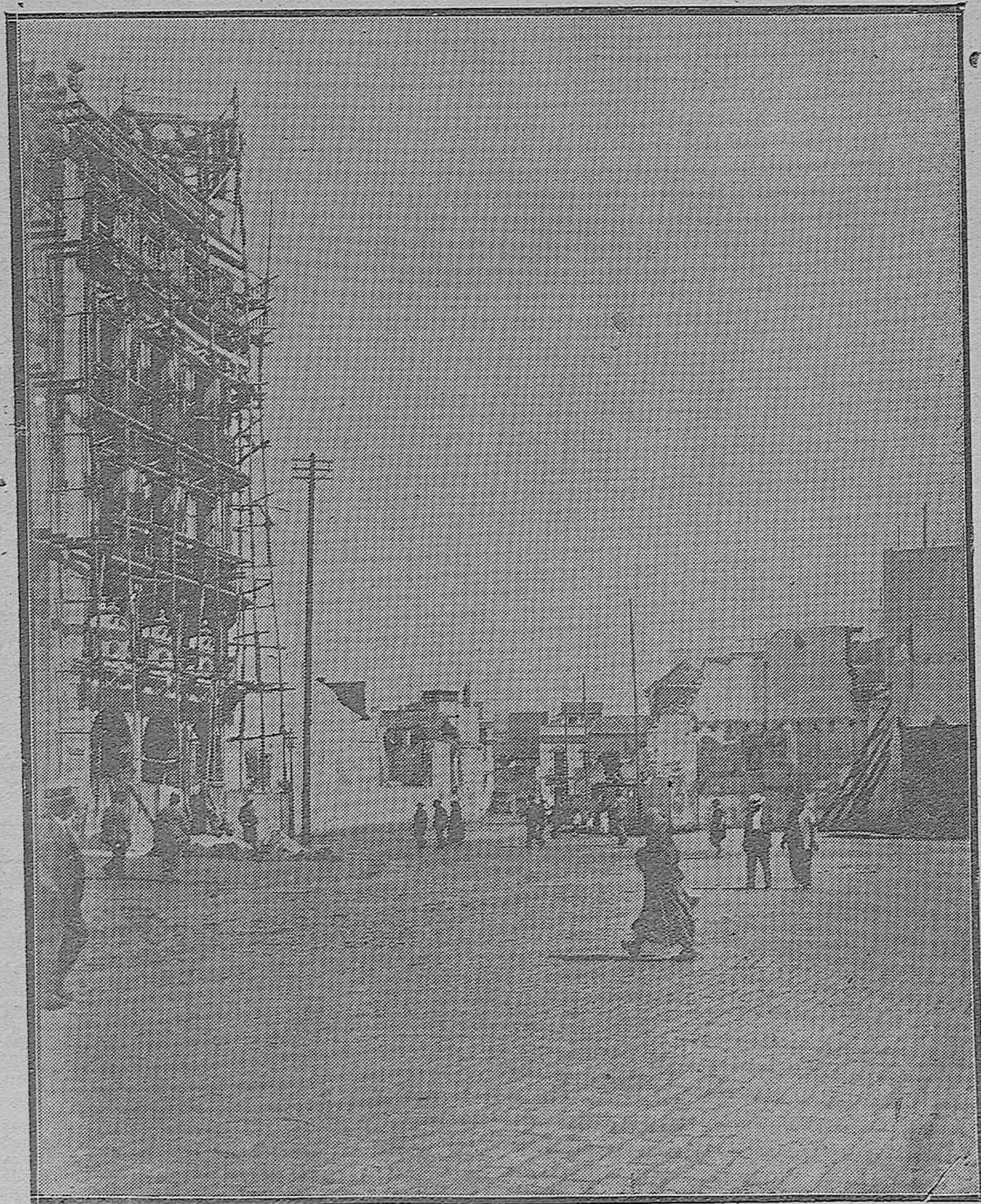
LAS REFORMAS DE NUESTRA CAPITAL.—Aspecto del primer trozo de la calle Cruz Conde que enlaza la Plaza de Cánovas con la calle de Góngora.