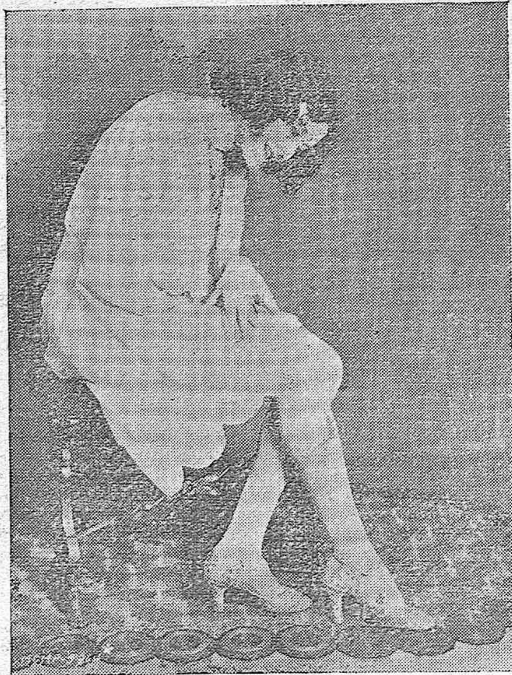
RAQUEL TORRES. LA BELLÍSIMA star DE CINE CONTEMPLA SUS MEDIAS PINTADAS SEGÚN LA ÚLTIMA POSTURA DE LA MODA.