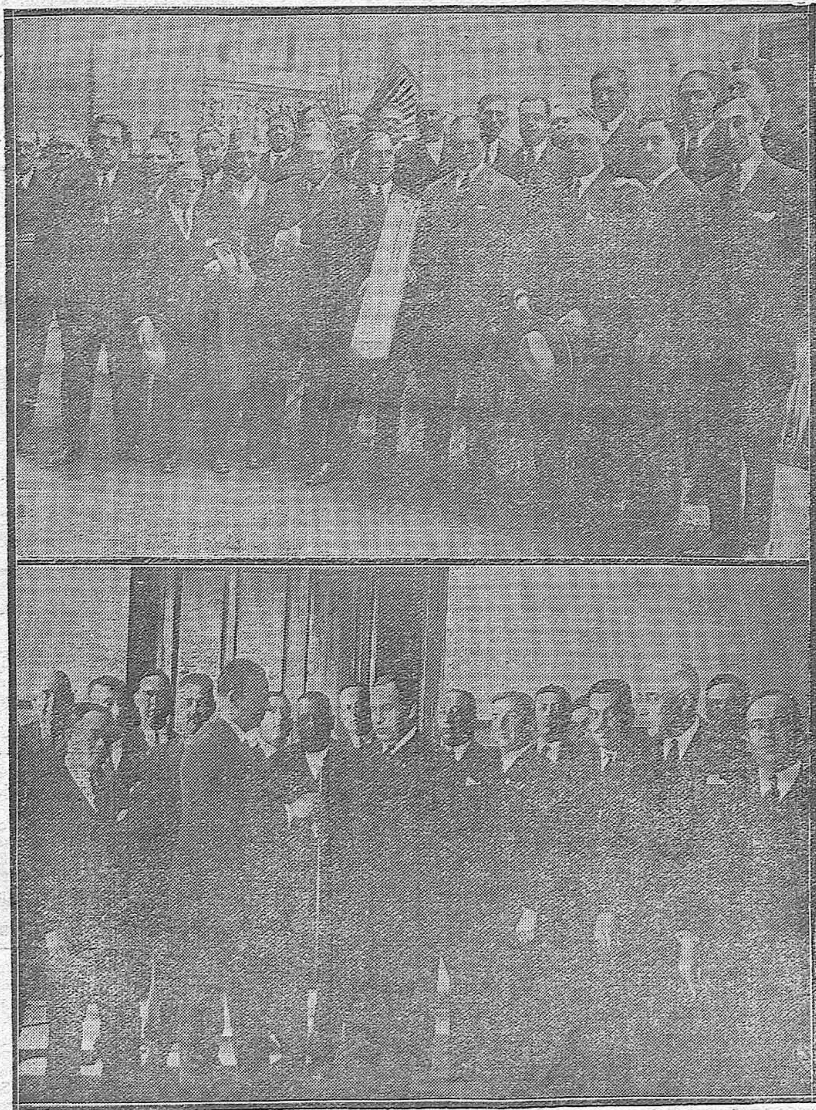
UN HOMENAJE A NUESTRO GOBERNADOR CIVIL.—Los alcaldes y los comisionados de los ayuntamientos del distrito de Estepa (Sevilla) al llegar al Gobierno civil para entregar al señor Palanca un bastón de mando, como recuerdo de su acertada gestión gubernativa como delegado de dicho distrito.—El señor Palanca recibiendo el bastón de manos del alcalde de Estepa.