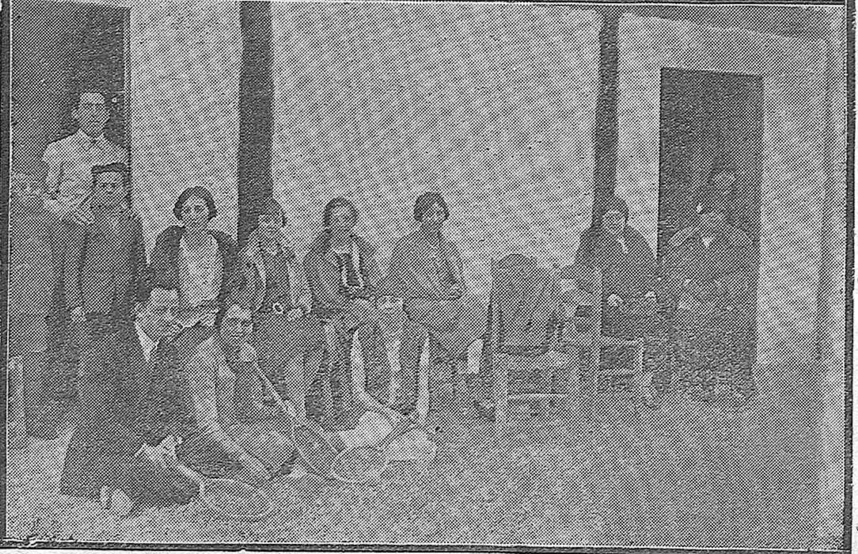
EL CENTENARIO DE GÓNGORA.—Distinguidas personalidades que presidieron la velada homenaje al inmortal poeta cordobés.—LOS DEPORTES CORDOBESES.—Grupo de jugadores de «tennis», en un momento de descanso.