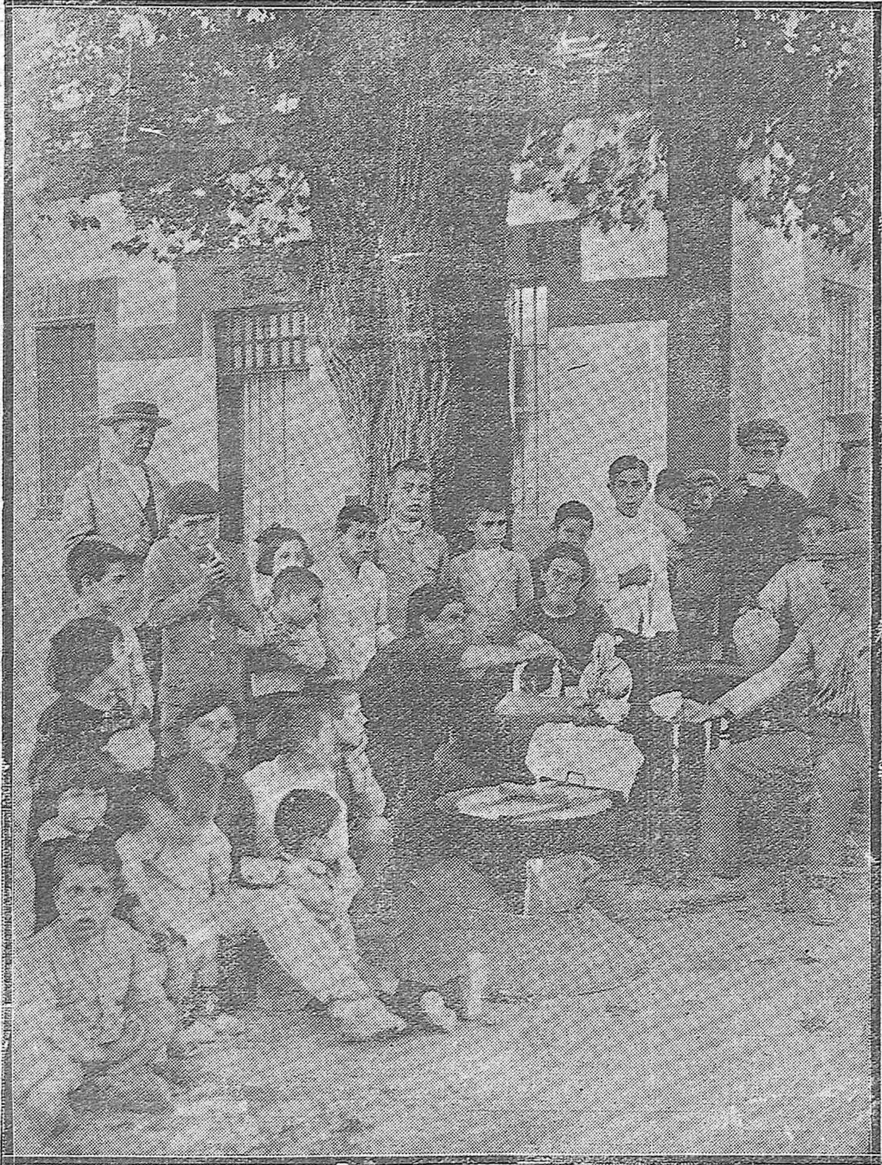
POR LOS BARRIOS BAJOS.— Una típica escena callejera.—La venta de caracoles durante la tarde en el barrio del Matadero.