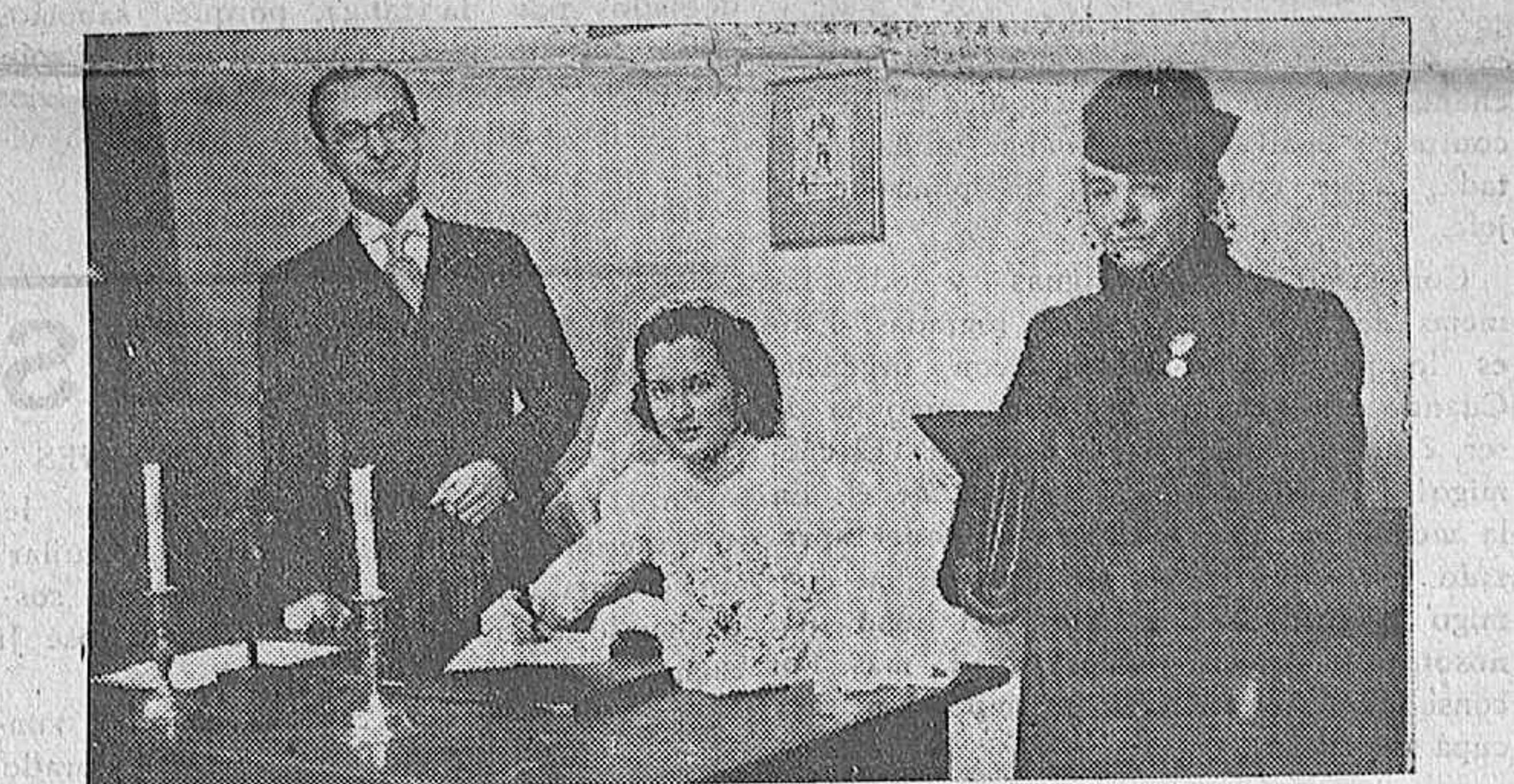
El nuevo matrimonio firmando el acta matrimonial en la Sacristía de la Parroquia del Salvador y Santo Domingo de Silos