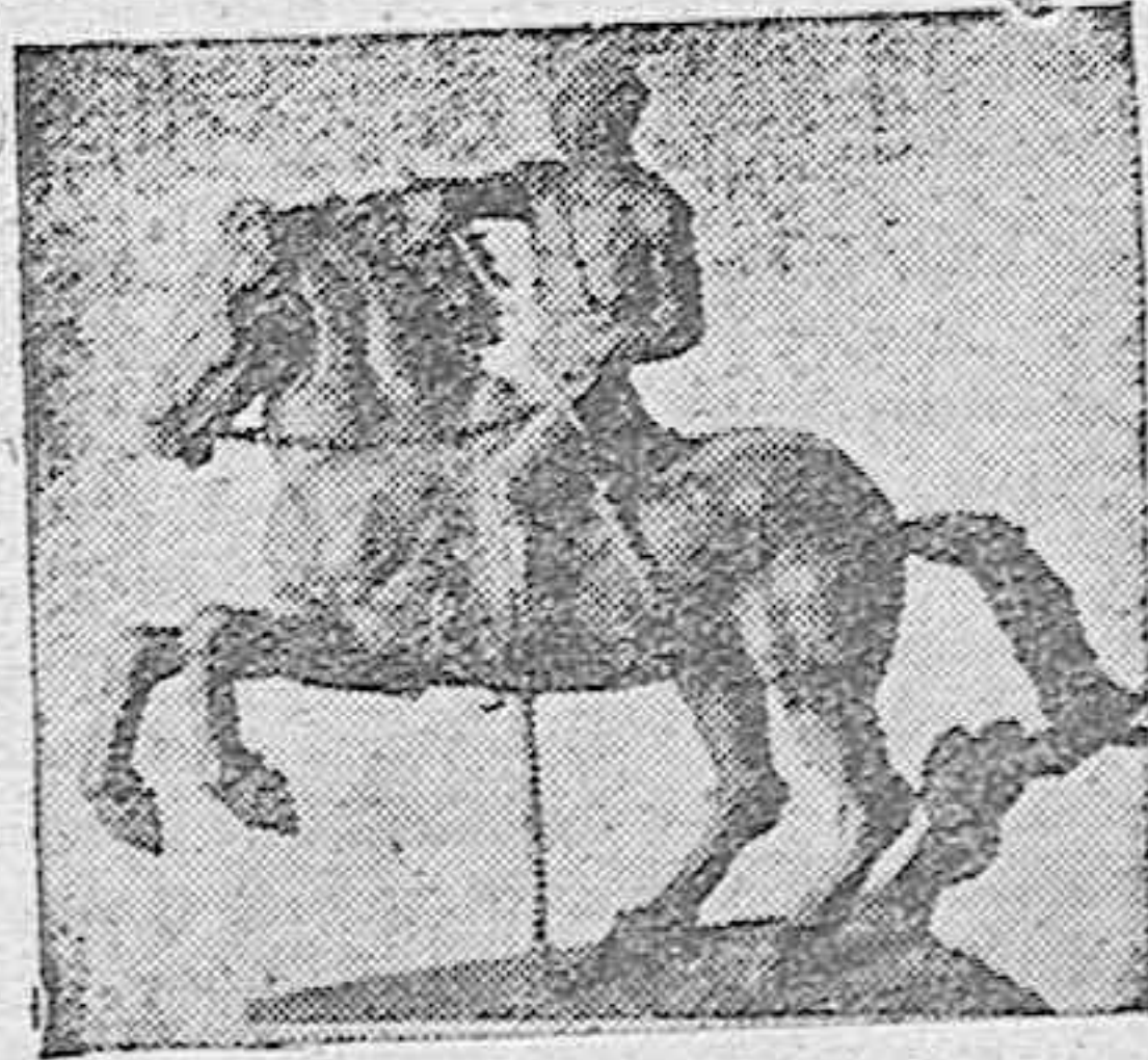
«El Alzamiento», escultura de Enrique Marín, que representa al Caudillo desenvainando la espada de la Victoria