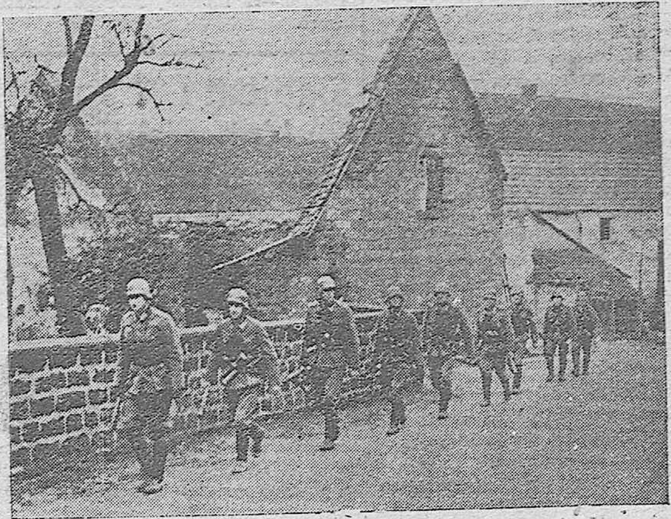
Patrulla alemana de exploración pasando por un pueblo del frente del Oeste.

do ante la firme voluntad de los países escandinavos y bálticos, de seguir manteniendo a toda costa su posición neutral. La prueba evidente de esto ha sido la negativa de Suecia de enviar divisiones de su Ejército a Finlandia. El rey de Suecia en sus recientes declaraciones, ha hecho ver claro a Inglaterra que debe abandonar sus planes en el Noroeste europeo. Y por último, el incidente del «Altmark» que ha colocado definitivamente a los países escandinavos frente a Inglaterra, ha venido a ser el golpe de gracia a las maniobras británicas.