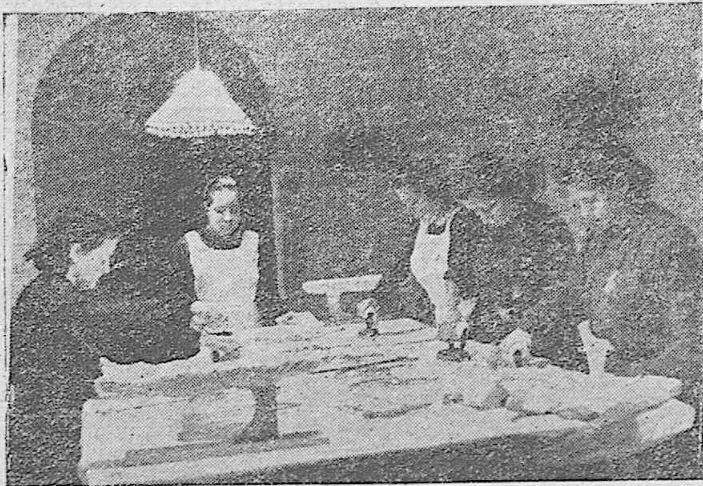
En todos los distritos de Madrid se han inaugurado Escuelas del Hogar establecidas por la Sección Femenina de Falange Española Tradicionalista y de las JONS.—En la sección de plancha de una de estas Escuelas del Hogar. (Foto Cifra).