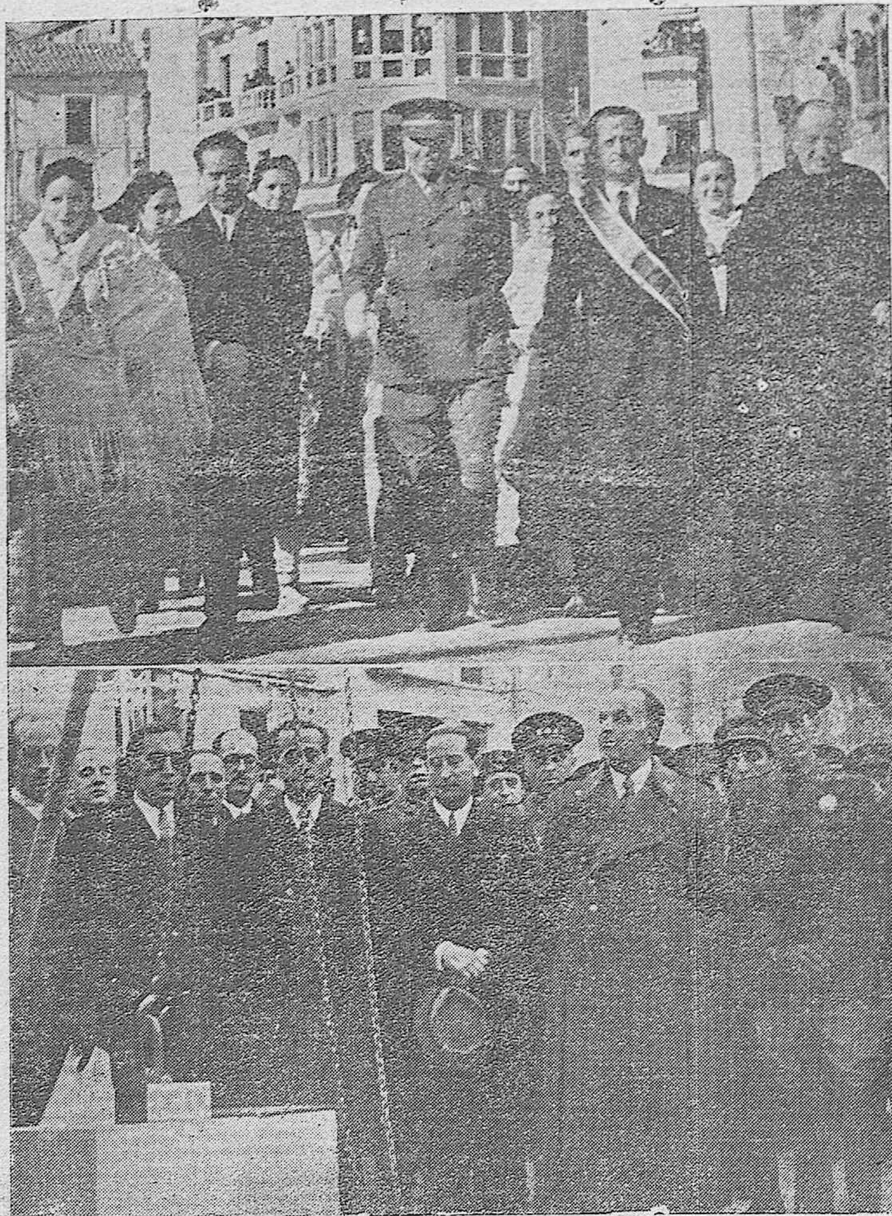
El ministro del Ejército, General Varela, con autoridades y jerarquías en la colocación de la primera piedra para la reconstrucción de Teruel.

CORDOBA — DOMINGO 25 DE FEBRERO DE 1940 — AÑO V — APARTADO DE CORREOS NUM. 2 — NUMERO 1.029