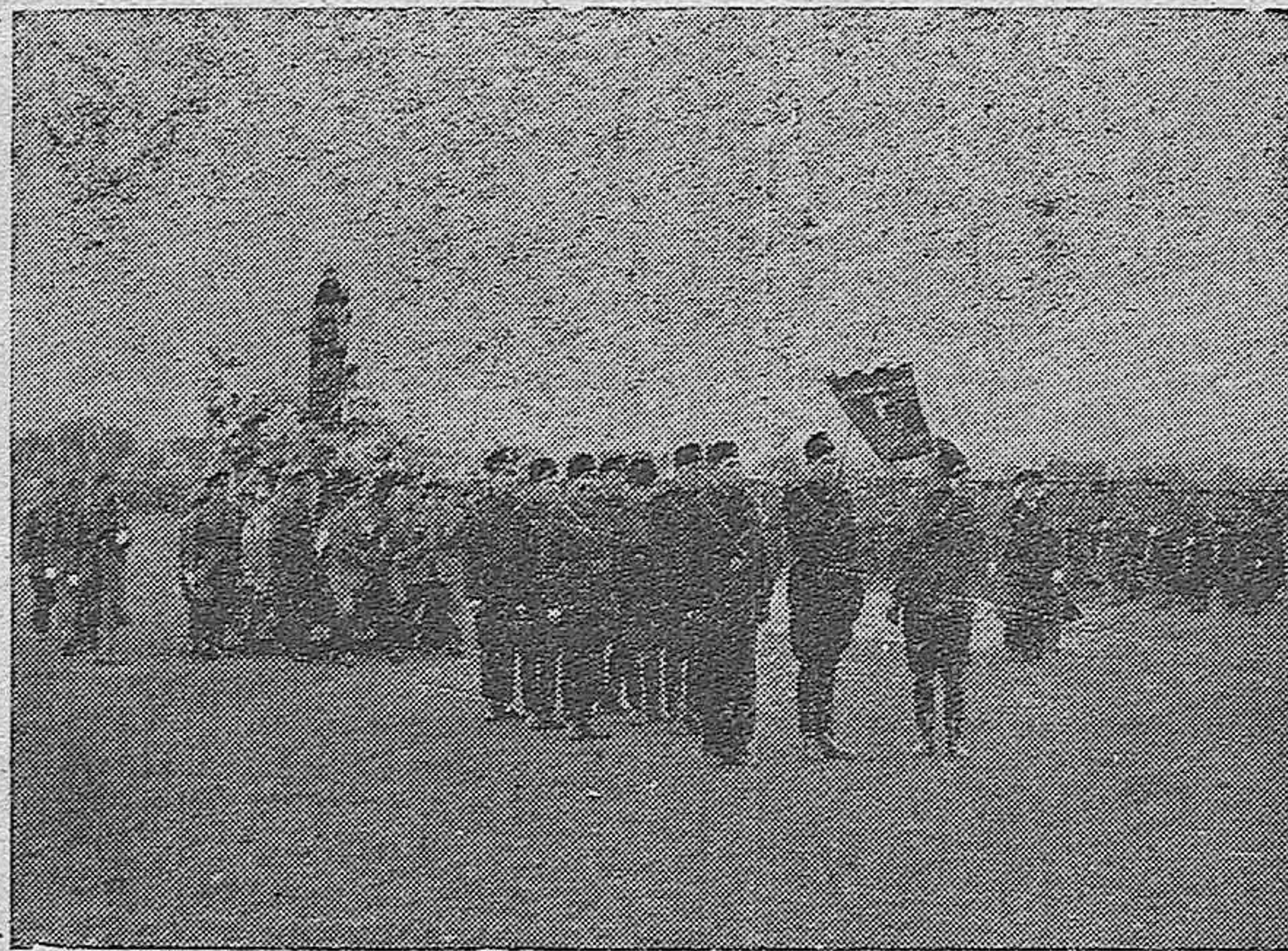
Carroza en la que la Virgen de Loreto fué entregada por el Fascio Italiano de Madrid, a la Aviación Española.

A raíz de la Conferencia del Desarme, se creyó preciso, para dar comienzo digno a las sesiones, una declaración dogmática que sirviera de punto