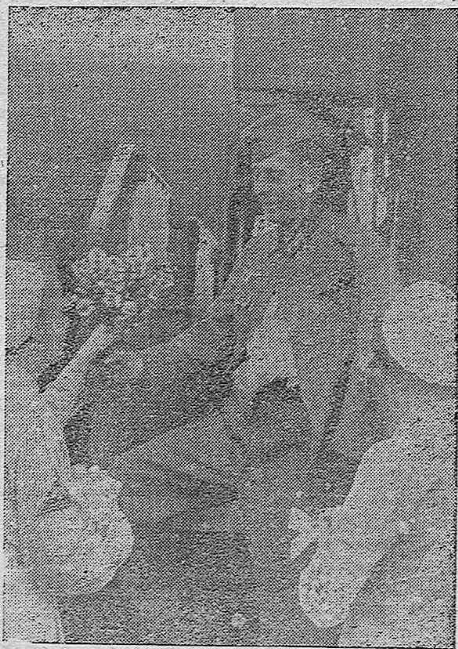
BERLIN.—Enfermeras de la Cruz Roja obsequian a un soldado herido, con flores y cigarrillos.

AYUDA CON TU DONATIVO A «AUXILIO SOCIAL» EN LA PRO- KIMA RECOGIDA DE ROPAS.