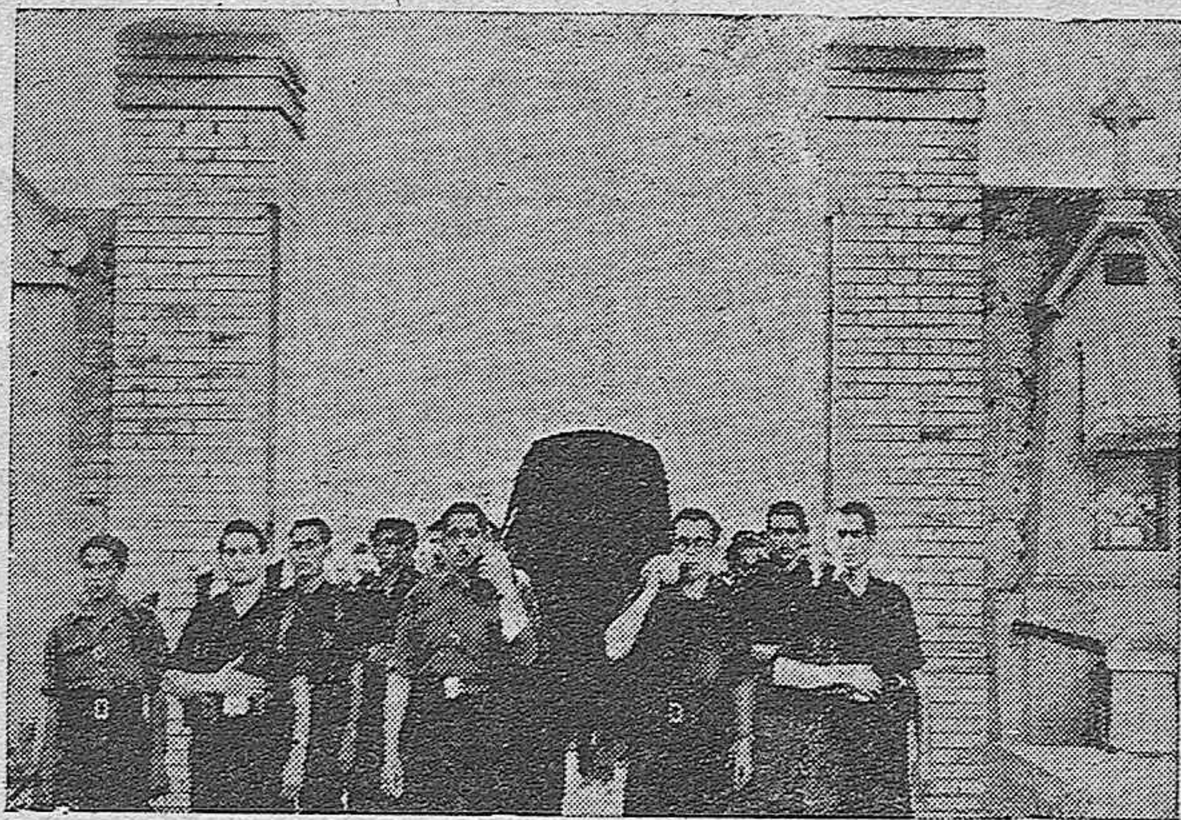
ALICANTE.—El cuerpo de José Antonio envuelto en la bandera de la Falange, sale del Cementerio a hombros de la vieja guardia

ininterrumpido, asociará un pensamiento a la memoria de Aquel que todo lo dió por la Falange, desde la idea hasta la vida, y esta sola frecuencia en hacer consciente su dolor, constituye, de por sí, un duelo más efectivo que el que pudieran imitar las veladuras y los crespones.