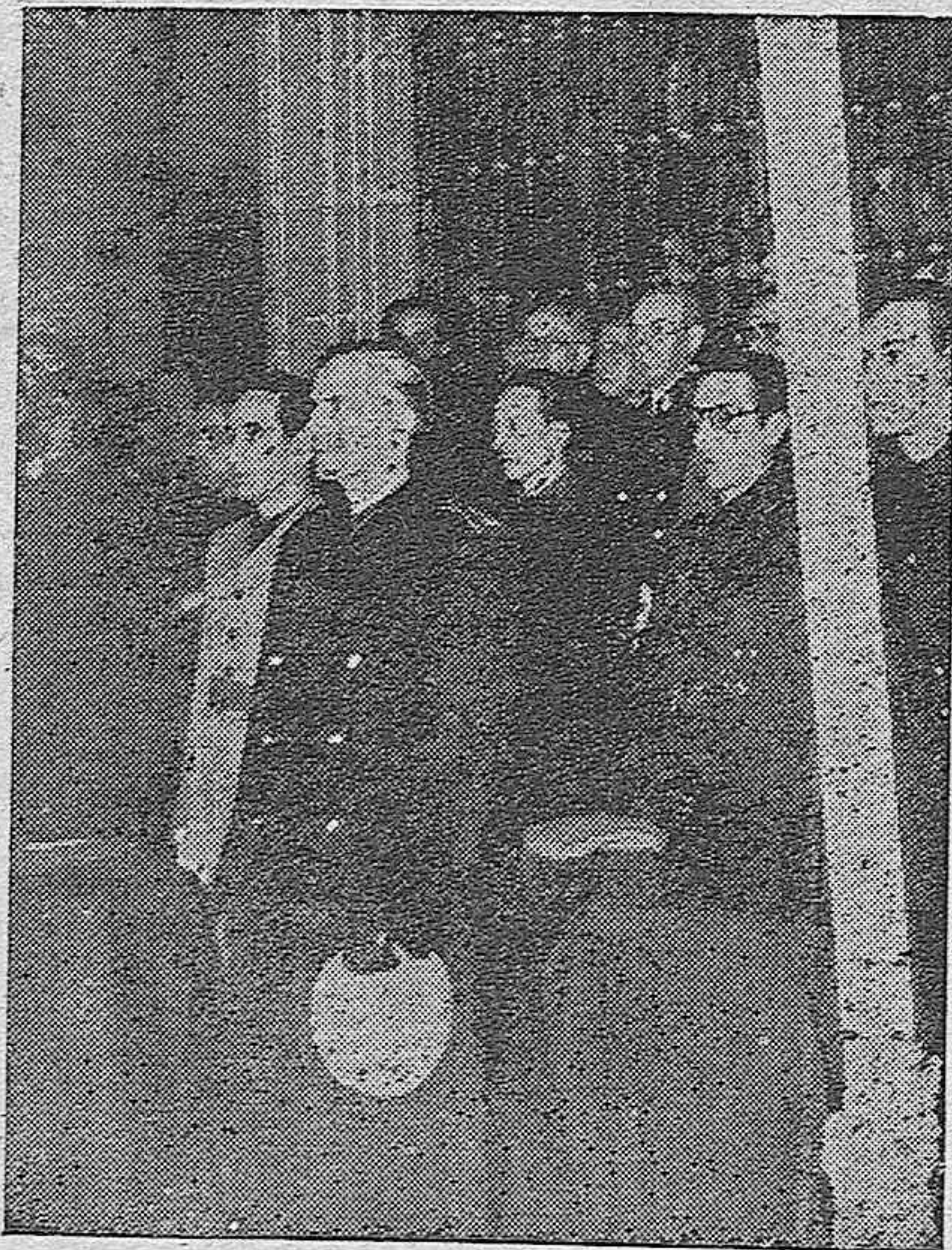
ALICANTE.—La Junta Política de Falange Española Tradicionalista y de las JONS, rezando el rosario en la capilla ardiente de José Antonio en la Iglesia de San Nicolás