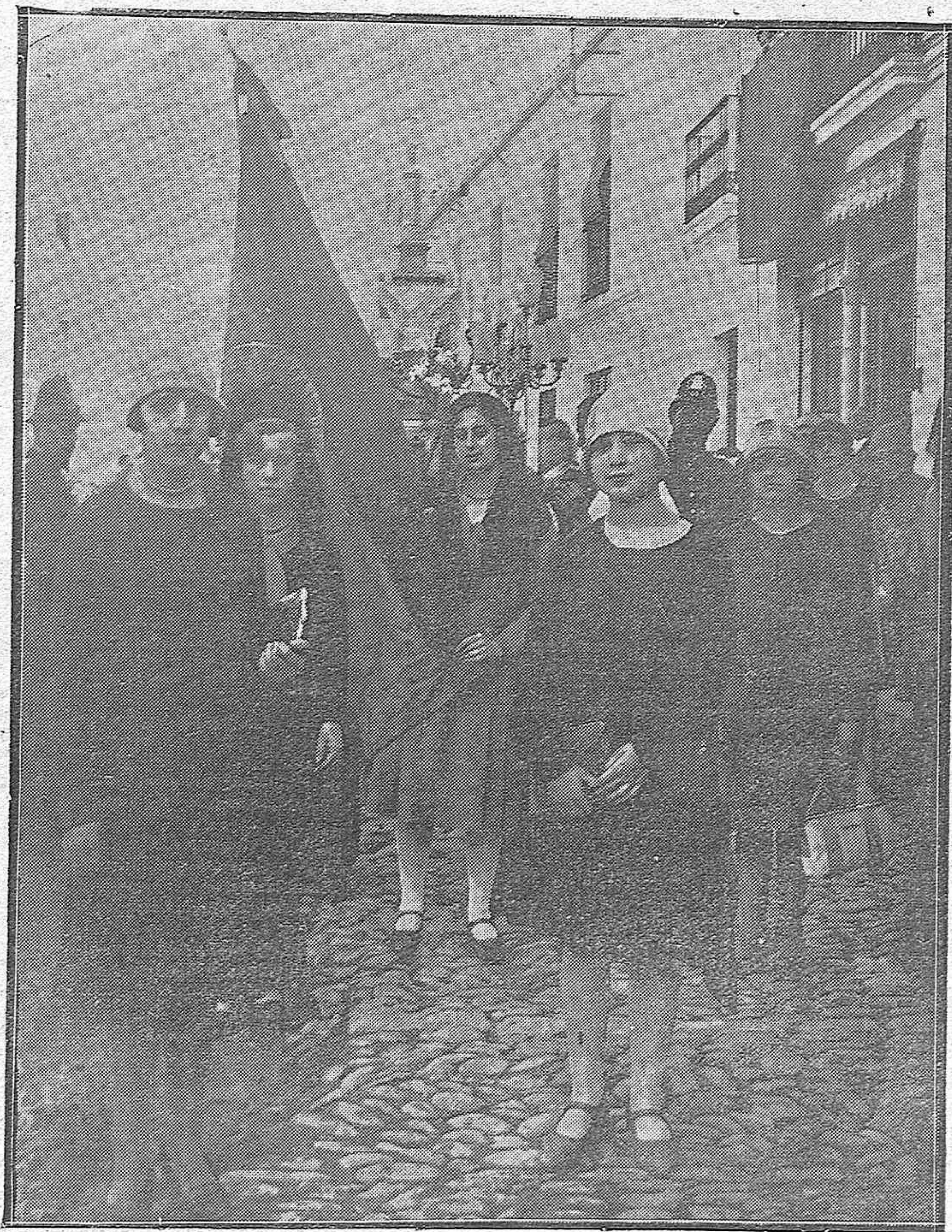
Un grupo de bellas señoritas normalistas, con su bandera, desfilando después de la solemne procesión de Cristo Rey.