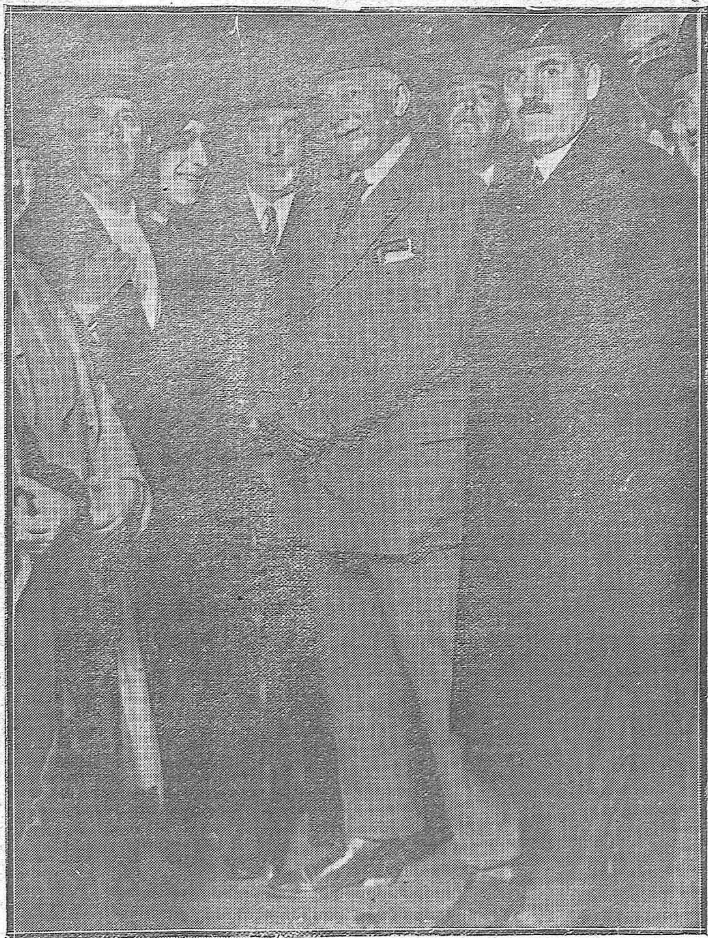
Anoche pasó por Córdoba el Excmo. Sr. Marqués de Estella con dirección a Madrid. Le acompañaba, entre otros ilustres viajeros, el Gobernador de Sevilla señor Cruz Conde. En la foto, el general Primo de Rivera, con el Gobernador Civil, el Alcalde y otras personalidades.