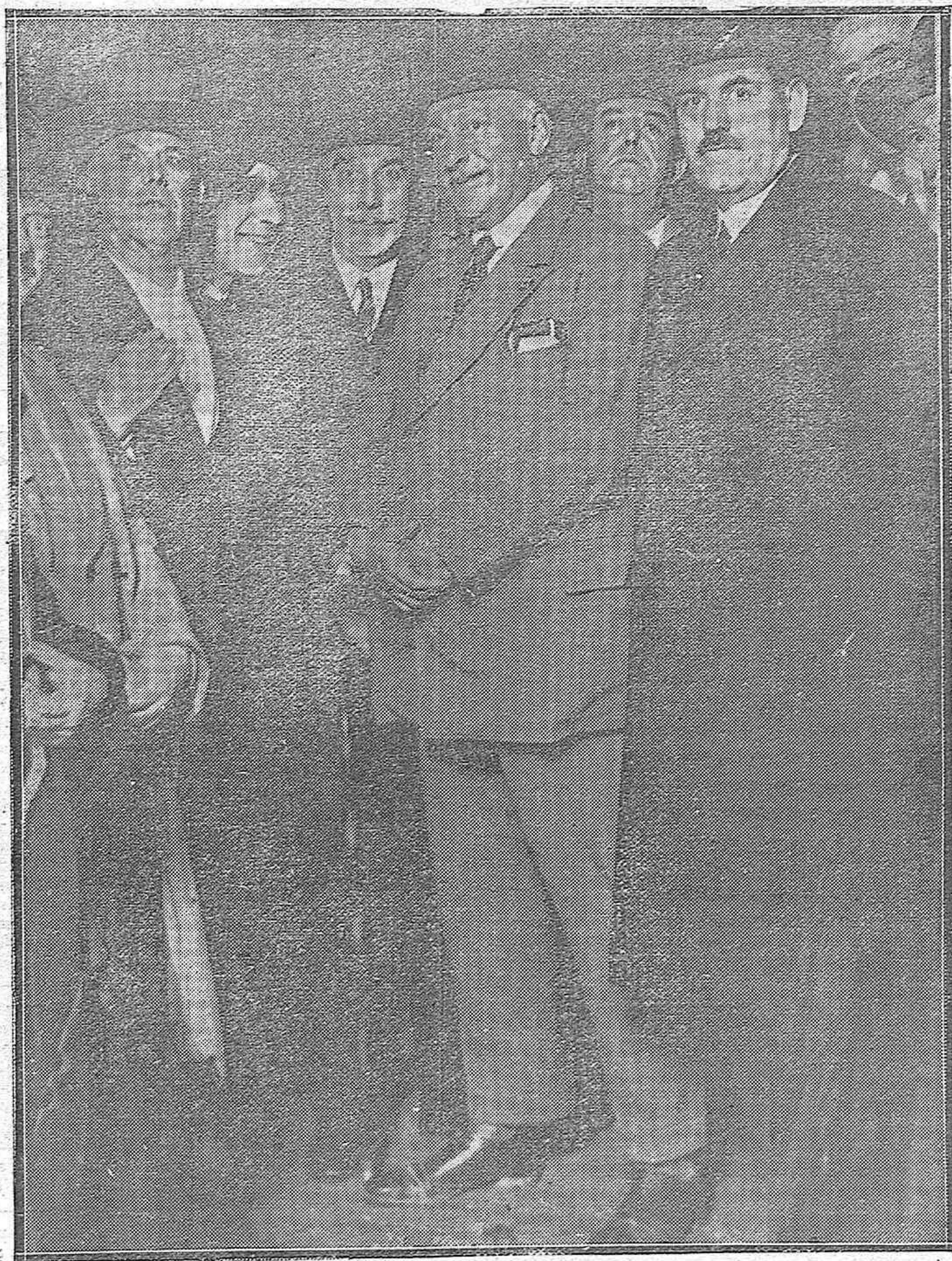
Anoche pasó por Córdoba el Excmo. Sr. Marqués de Esteliza con dirección a Madrid. Le acompañaba, entre otros ilustres viajeros, el Gobernador de Sevilla señor Cruz Conde. En la foto, el general Primo de Rivera, con el Gobernador Civil, el Alcalde y otras personalidades.