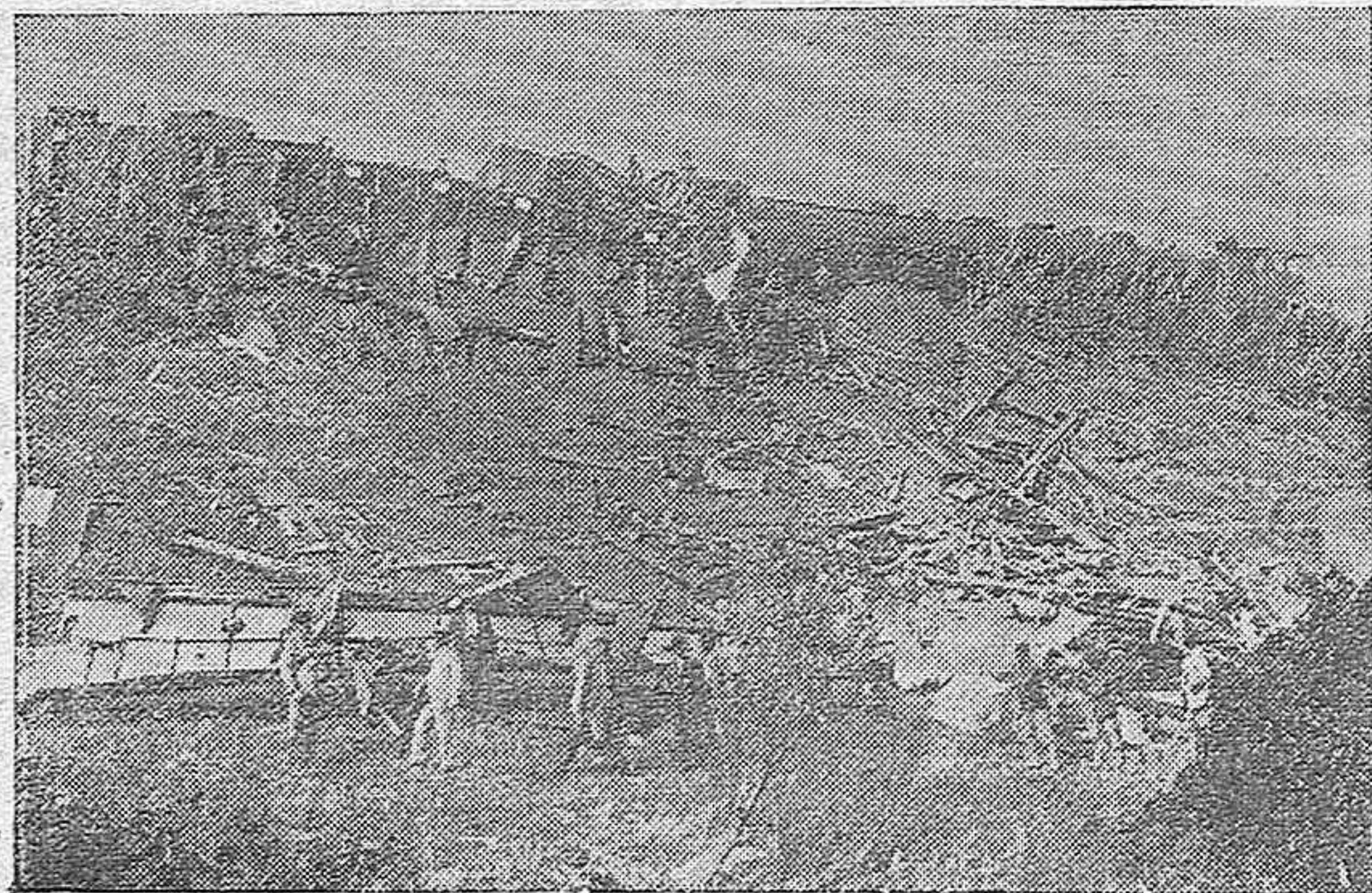
ASPECTO DEL LUGAR DEL SINIESTRO. LAS MÁQUINAS DE AMBOS EXPRESOS QUEDARON MATERIALMENTE EMPOTRADAS.