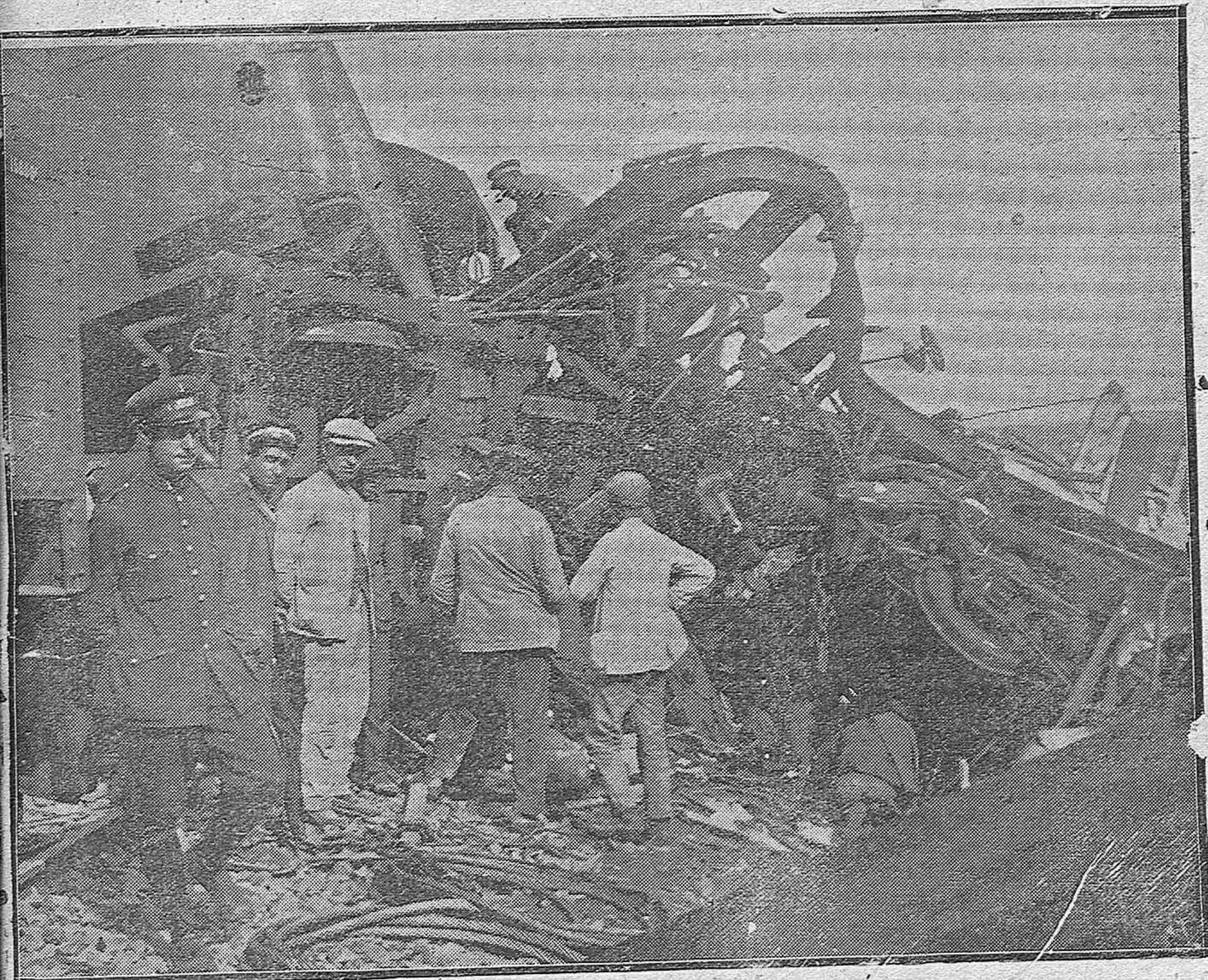
El choque de expresos en Madrigueras.--Restos del coche Correo del expreso ascendente, de entre los cuales fueron extraídos los dos cadáveres de los infortunados oficiales de Correos