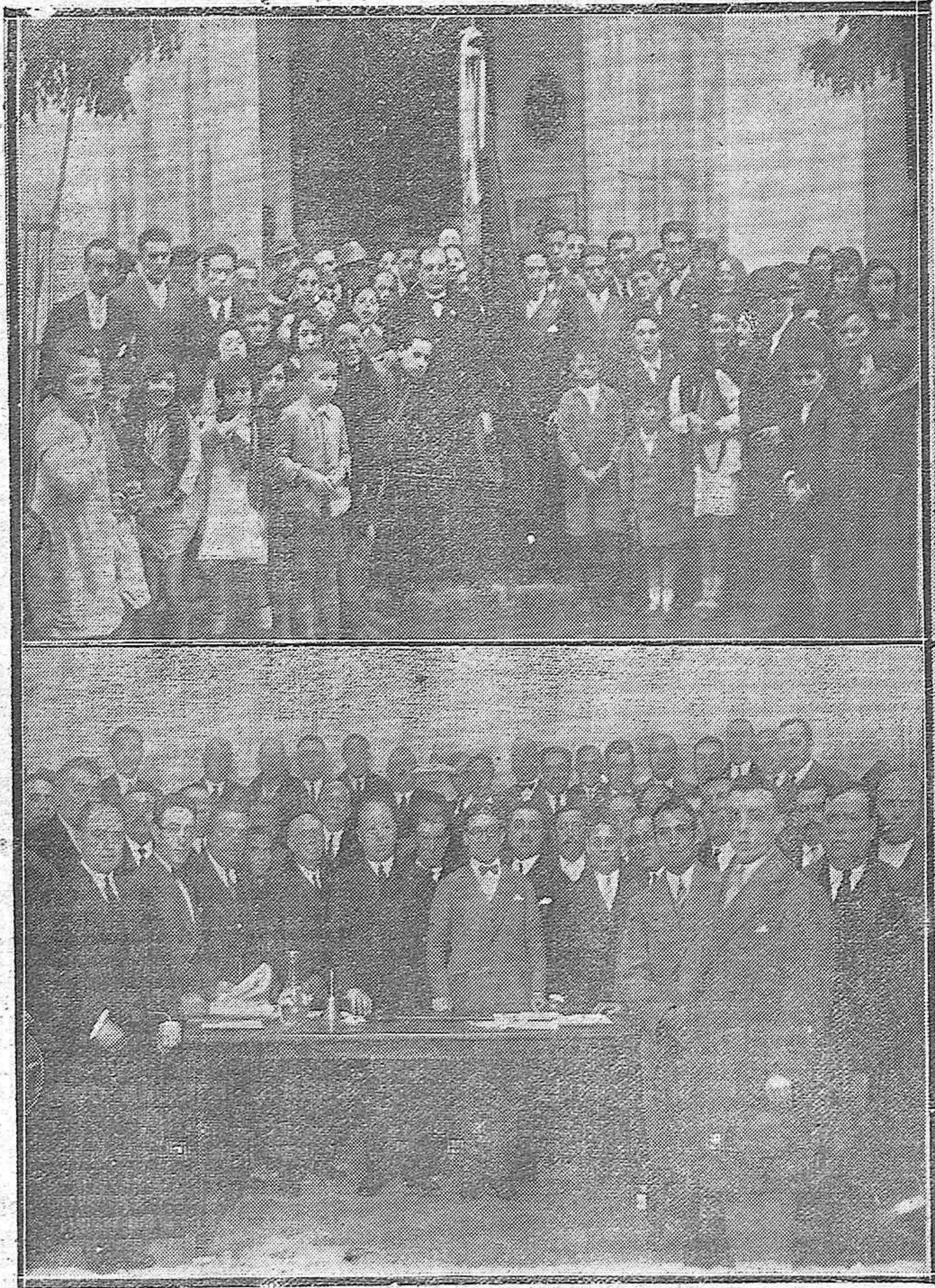
NOTAS GRÁFICAS DEL DOMINGO.—LA AGRUPACIÓN MUSICAL «FIGARO CORDOBÉS» AL SALIR DE LA IGLESIA DE SAN ANDRÉS; DONDE SE CELEBRÓ UNA FIESTA RELIGIOSA, Y SE LE IMPUSIERON DOS CORBATAS A LA BANDERA DE DICHA ENTIDAD.—ASAMBLEA PROVINCIAL DE AGENTES DE COMERCIO Y COMISIONISTAS CELEBRADA EN EL CIRCULO MERCANTIL.