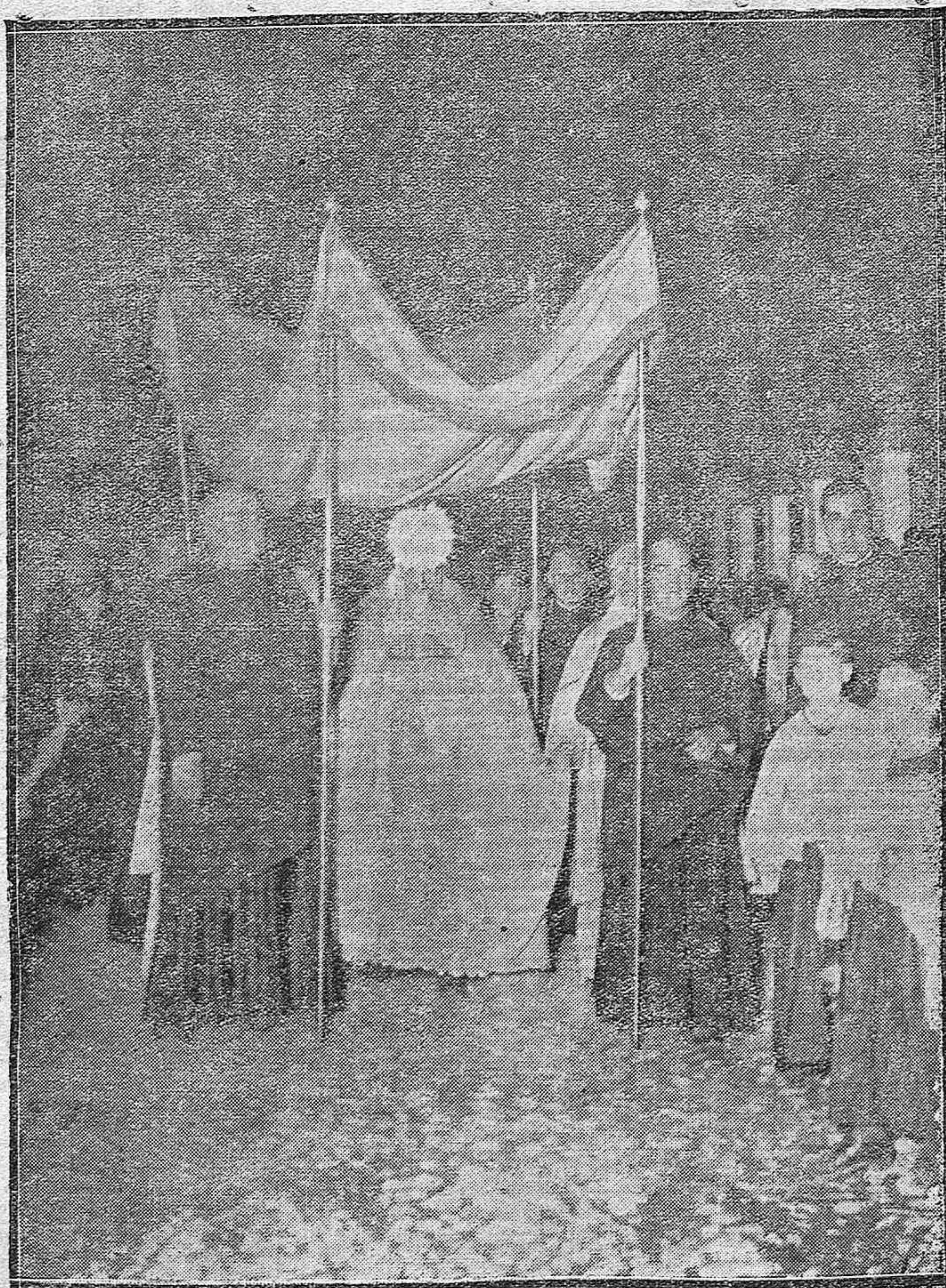
Procesión con el Santísimo que como final de los cultos a la Virgen de la Fuensanta salió de dicha ermita anoche, recorriendo aquellos parajes.