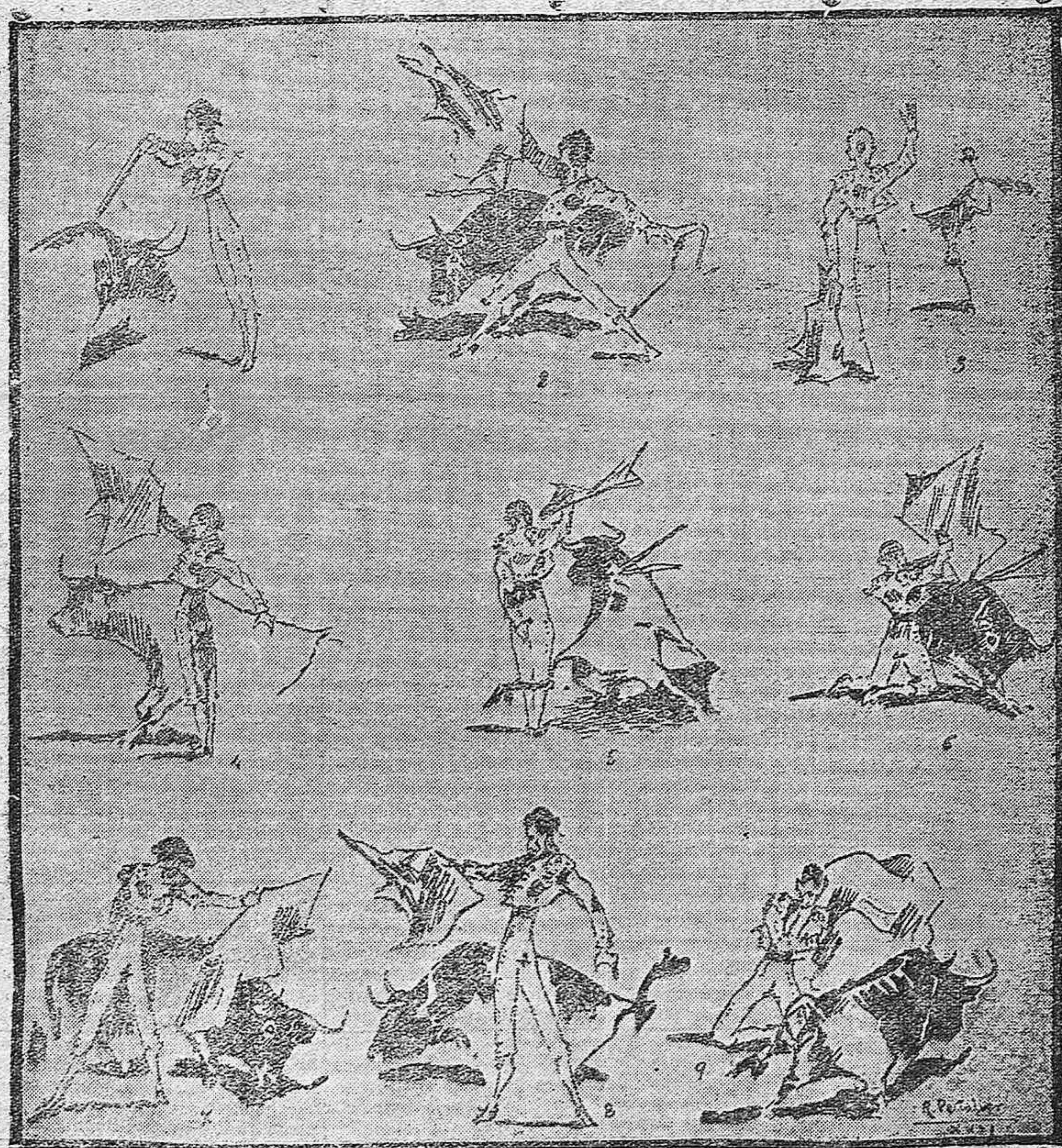
De las corridas de Posadas.—1, 2, 3) Alamares en el tercer día.—4, 5, 6) Rubito de la Estación en el 2.º día.—7) Adrián Peñalver en una gran verónica el segundo día.—8, 9) El mismo diestro el tercer día.