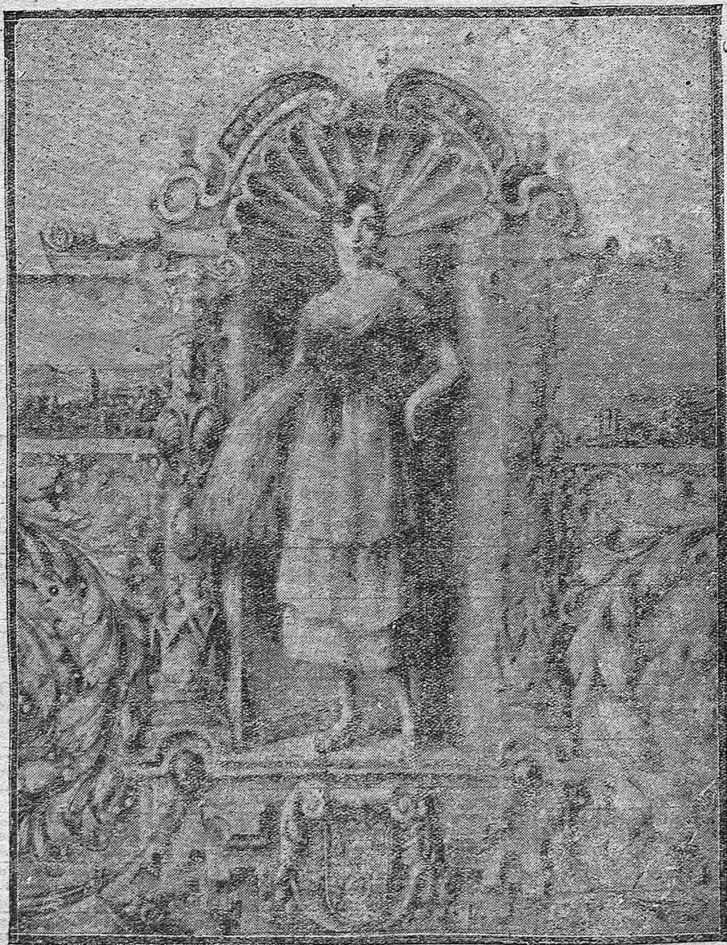
Representación de la Córdoba agrícola, fragmento del pergamino, obra del notable artista Rafael Bernier, que las Cámaras ofrecen al jefe del Gobierno.