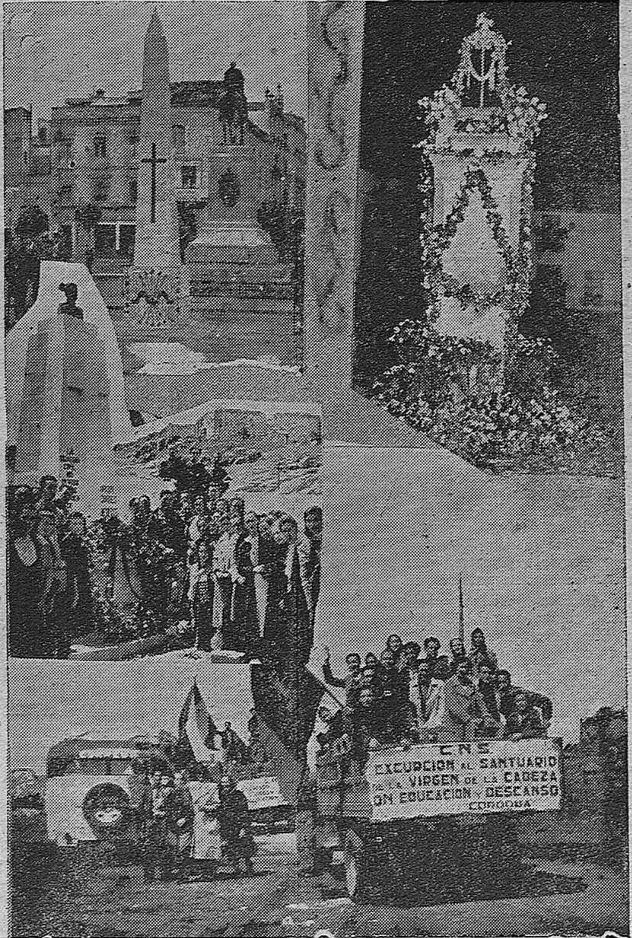
El Obelisco levantado por la Organización Juvenil en la Plaza de José Antonio.—La Cruz de la Plaza del Moreno, luce fragantes galas en la fiesta tradicional.—Varios momentos de la excursión realizada por «Educación y Descanso» al Santuario de Nuestra Señora de la Cabeza.