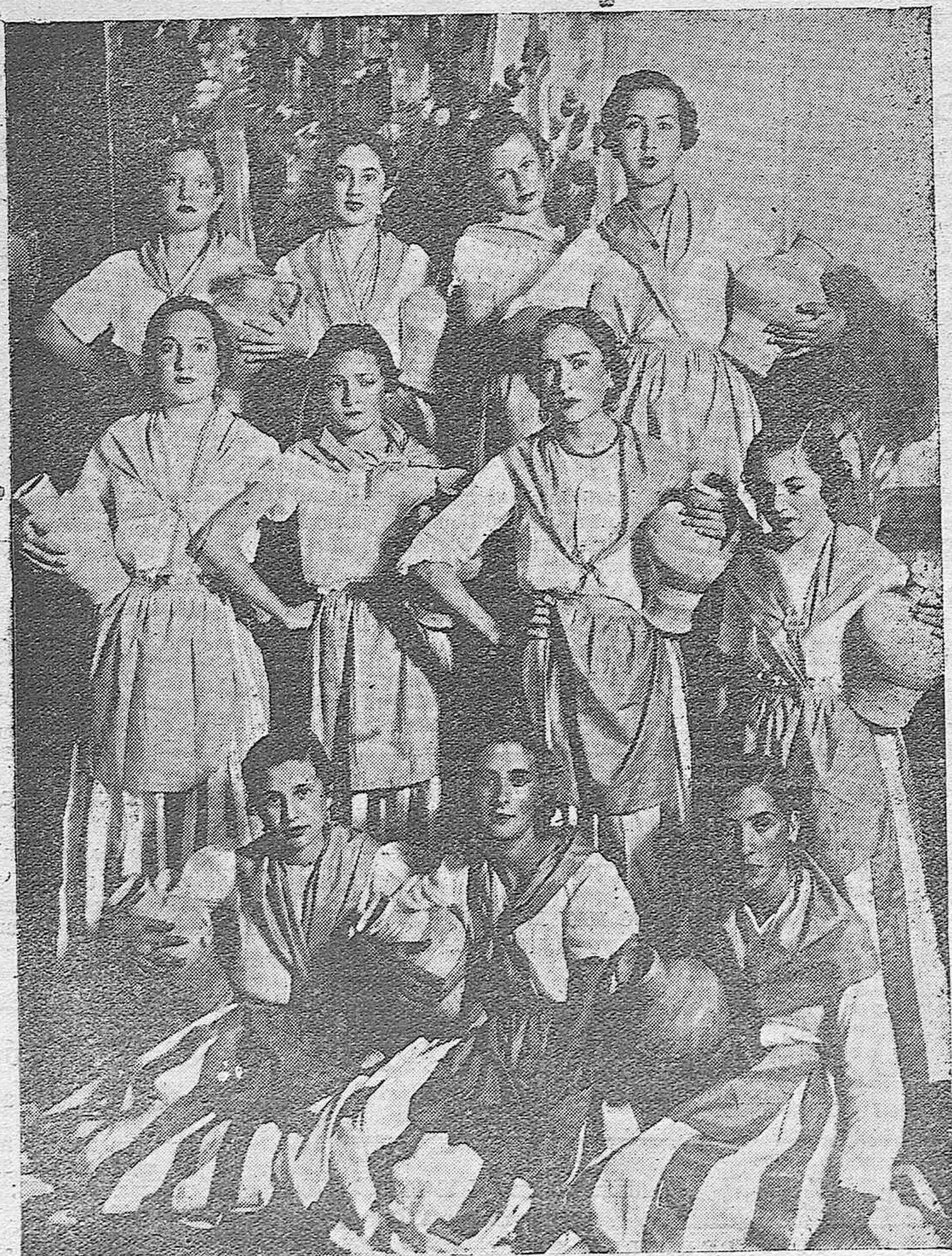
Bellas señoritas que tomaron parte en el festival teatral celebrado en el Teatro de la calle de Valladares con fines benéficos, representando el número "Caminito de la Fuente"