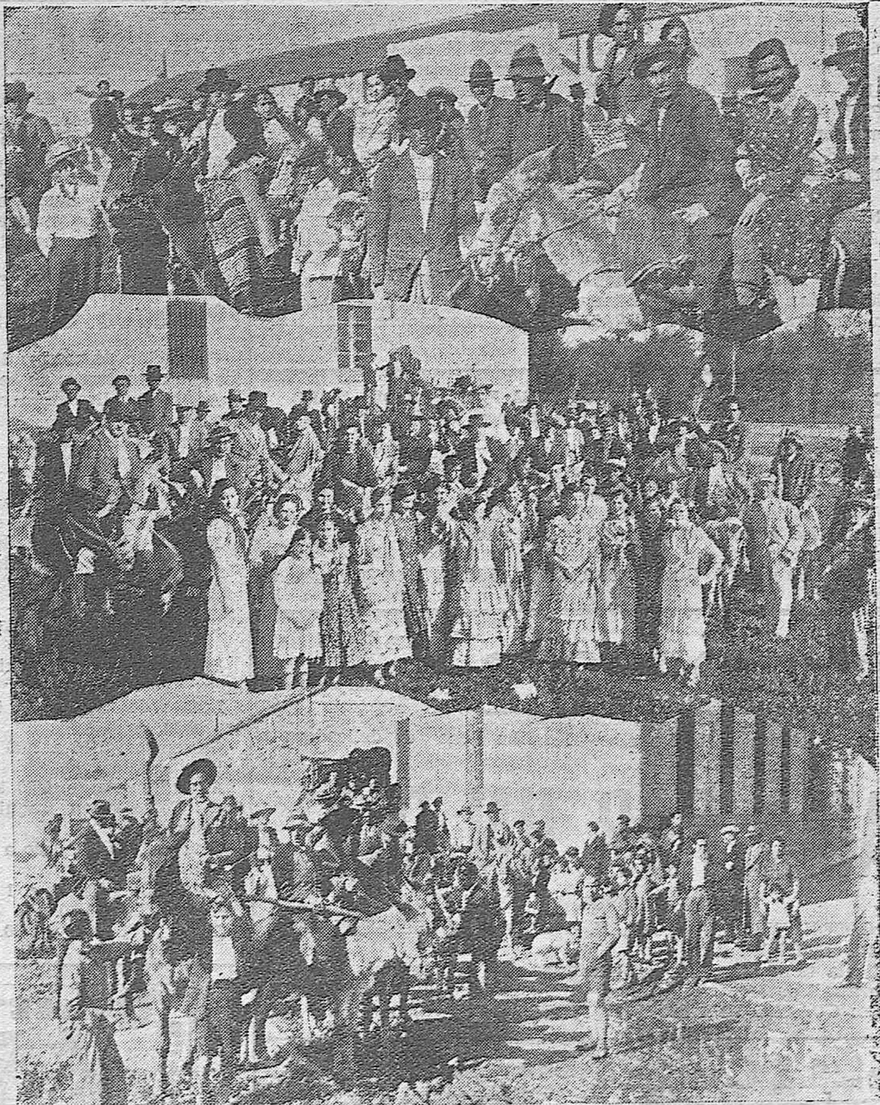
Se celebró el segundo acto de la Romería a Santo Domingo.—Varios detalles de los romeros.—Grupo de la Sociedad "Los 99", asistiendo todos los socios montando en burro y cuyo desfile al regreso, llamó grandemente la atención